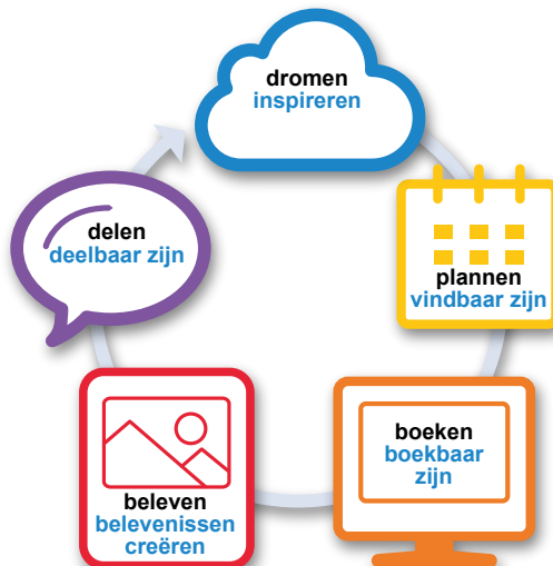
Figuur 1: Het vakantiebelevingsproces van consumenten met het perspectief van aanbieders (Buitendijk en Van de Mosselaer, 2014)

Buitendijk en Van de Mosselaer (2014) toonden het travel funnel model, waarin Google de consumentenbeleving van vakantie- en vrijtijdsproducten beschrijft. Google knipt de fase vóór de vakantie daarin verder op, in dromen, plannen en boeken. Dit model bestaat daarom in totaal uit vijf fasen. Buitendijk en Van de Mosselaer stelden vervolgens dat de vrijtijdssector een belangrijke rol speelt in al die vijf fasen, zoals weergegeven in figuur 1. In de fasen voordat consumenten overgaan tot een bezoek, is de mate waarin de sector inspireert, vindbaar en boekbaar is - zowel online als offline - bepalend. Tijdens het bezoek zullen aanbieders zorg moeten dragen voor positieve ervaringen die passen bij de behoeften van verschillende doelgroepen. Tot slot is de mate waarin consumenten hun ervaringen kunnen delen met anderen een belangrijke factor; zowel tijdens als na het bezoek.