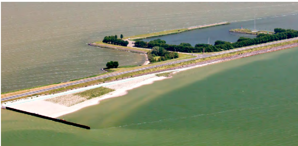
Proefsectie in juli 2016.

De foto's laten ook zien dat de morfologische veranderingen in deze periode uiterst beperkt zijn. Het proefvak ligt er nog steeds stabiel bij en er is geen sprake van structureel verlies van materiaal.