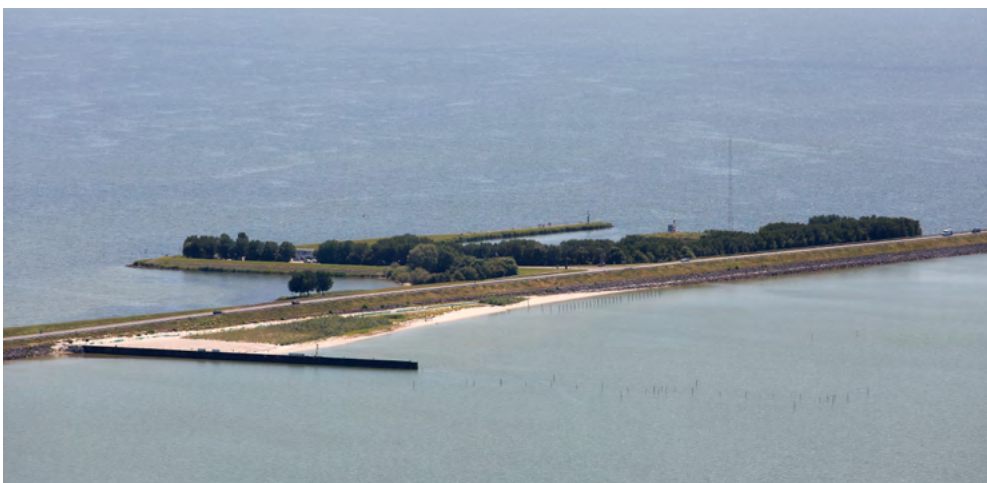
Situatie in juni 2017.