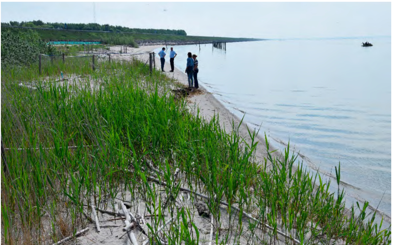
Buitenrand van de vegetatie.