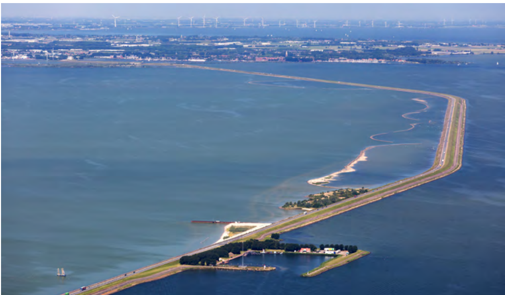
Het westelijke deel van de Houtribdijk, waarbij aan de linkerkant in de 'driehoek' de pilot zichtbaar is.

De pilot loopt tot begin 2018. De metingen gaan daarna door, maar dan over de volle lengte van de Houtribdijk. Meuldijk: “We meten tijdens de aanleg en ook daarna, om de dijk goed te kunnen beheren. We willen onder meer de ecologie, zandverstuiving en vegetatieontwikkeling gaan volgen. Ik hoop ook een promovendus aan ons project te verbinden, om de kennis over deze versterking te verdiepen. De kennis die we hier opdoen is zeer bruikbaar in Nederland en daarbuiten. Dit project kan een nieuwe showcase worden voor waterbouwend Nederland.”