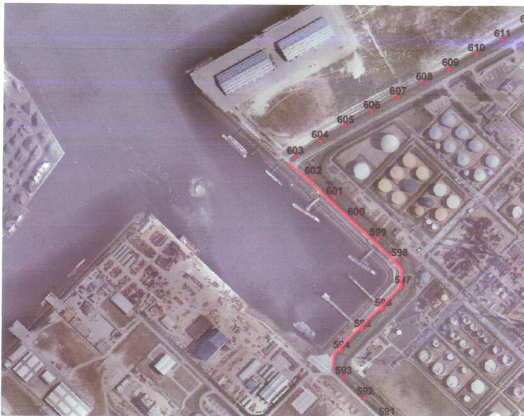
Figuur 2. Luchtfoto van planlocatie en omgeving