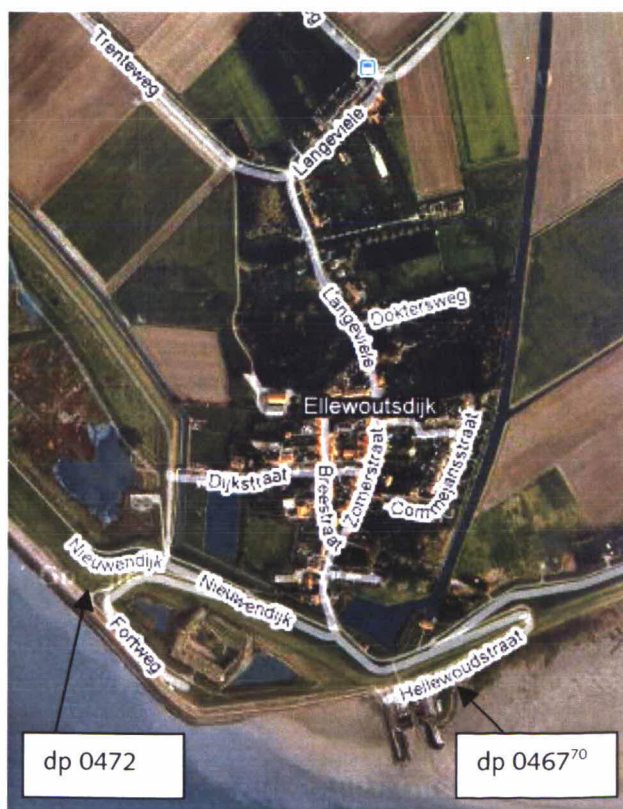
Figuur 1: Luchtfoto Ellewoutsdijk, Fort en Haven

Een luchtfoto van het traject is weergegeven in figuur 1.