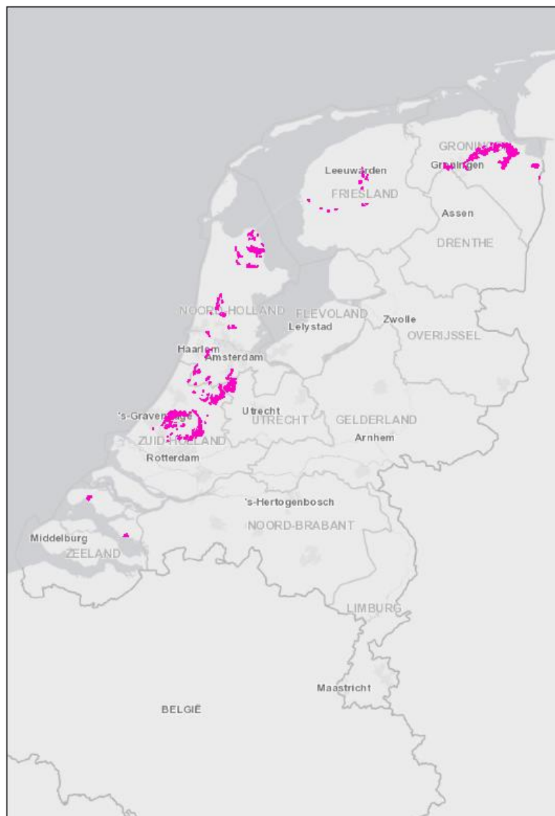
Afbeelding 2: Ligging van potentiële kattekleigronden in Nederland. Deze kaart is digitaal beschikbaar als shape-file bij programmabureau HWBP-2 en op website

De keuze van de te nemen maatregel(en) kan het beste bij het project gelegd worden. Als waarborg dat er daadwerkelijk geen significante corrosie door pH verlaging opgetreden heeft, moet een testplank bij de damwand geslagen worden.