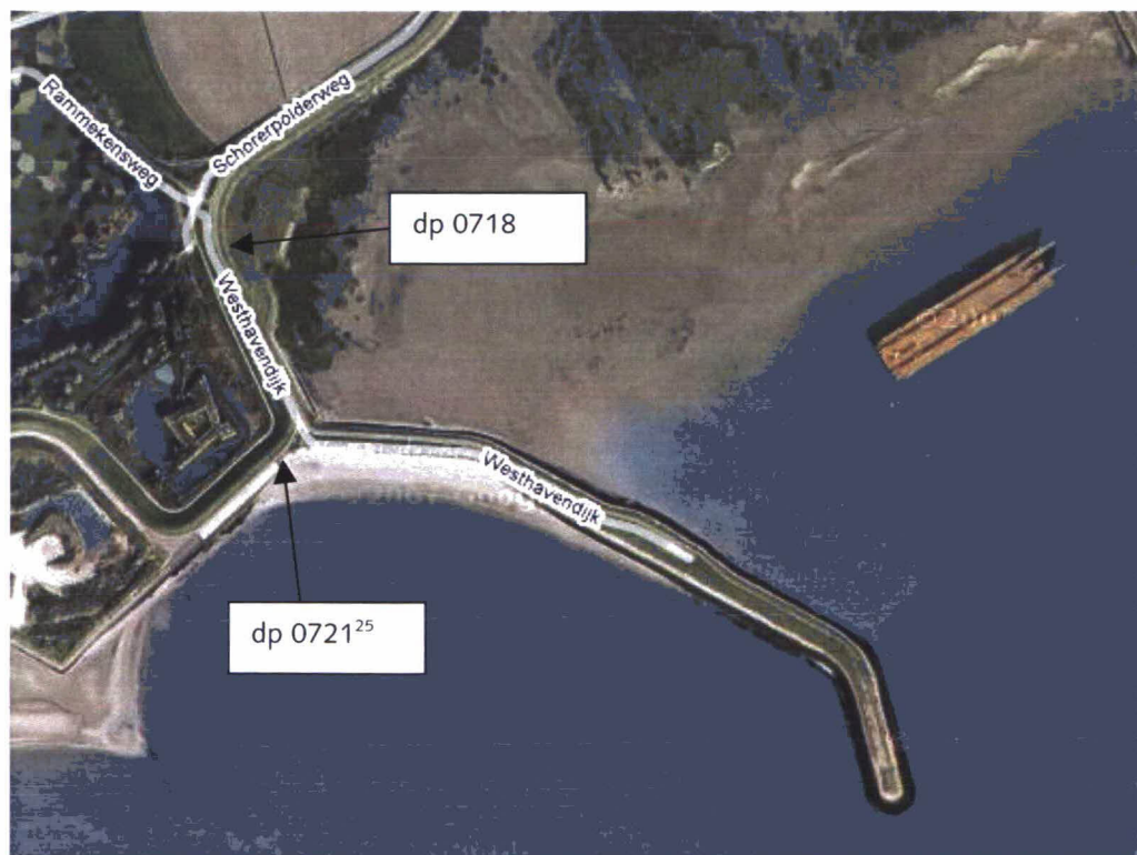
Figuur 1: Luchtfoto Westelijke Sloehavendam, Schorerpolder

Een luchtfoto van het traject is weergegeven in figuur 1.