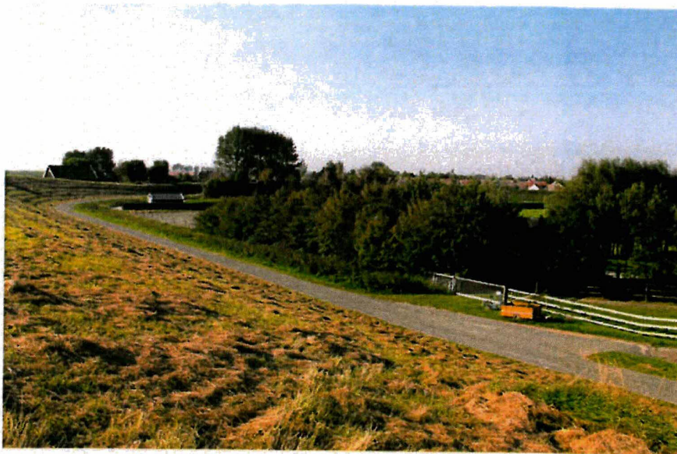
Figuur 1.2 Binnendijkse akkers en bosschages ter hoogte van het gemaal bij Waarde.