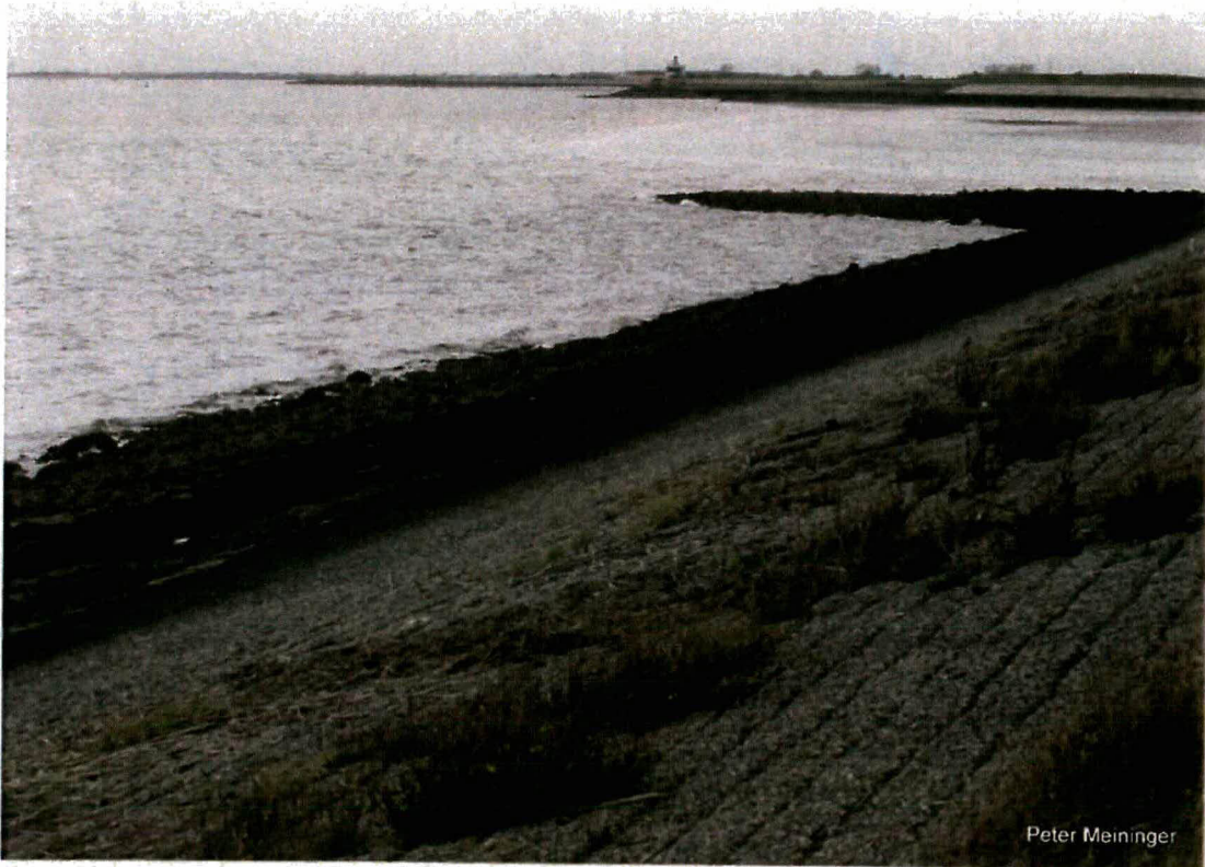
Figuur 4.1 Kreukelberm en voorland bij laagwater ter hoogte van dp 180