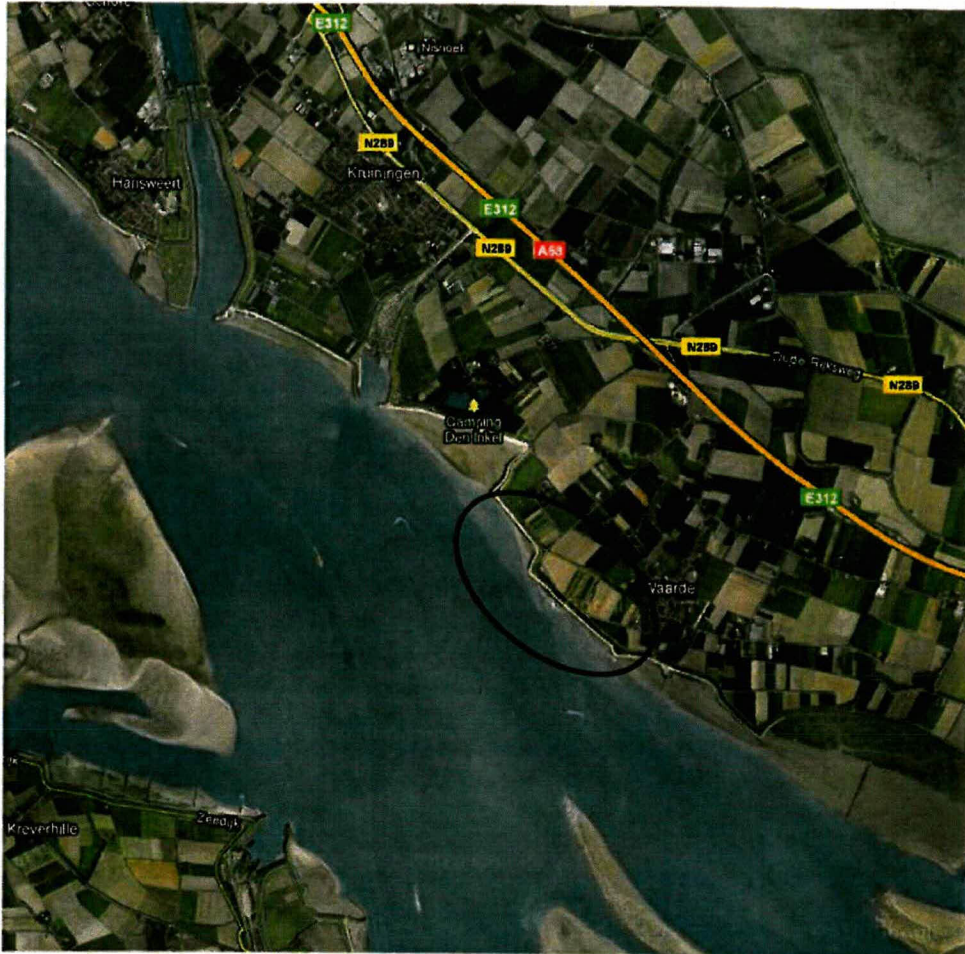
Figuur 1.1. Ligging van het projectgebied op regionaal niveau (zwarte cirkel)