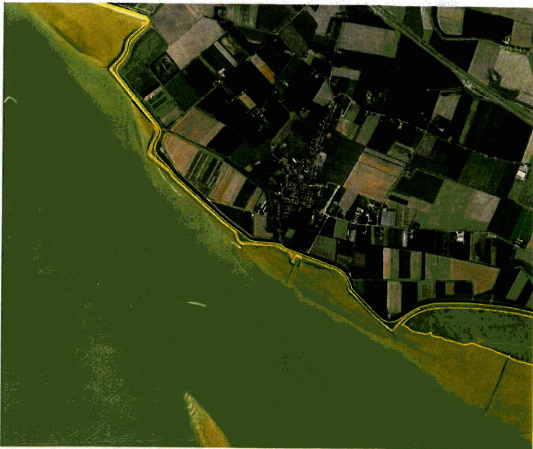
Figuur 1.3 Begrenzing Natura2000 gebied Westerschelde –Saefinghe ter hoogte van het projectgebied (website ministerie EL&I, oktober 2011) .

De grens van het Natura 2000 gebied Westerschelde – Saeftinghe ligt op de buitenkruinlijn. Het projectgebied maakt dus officieel onderdeel uit van het Natura 2000 gebied (zie onderstaande figuur).