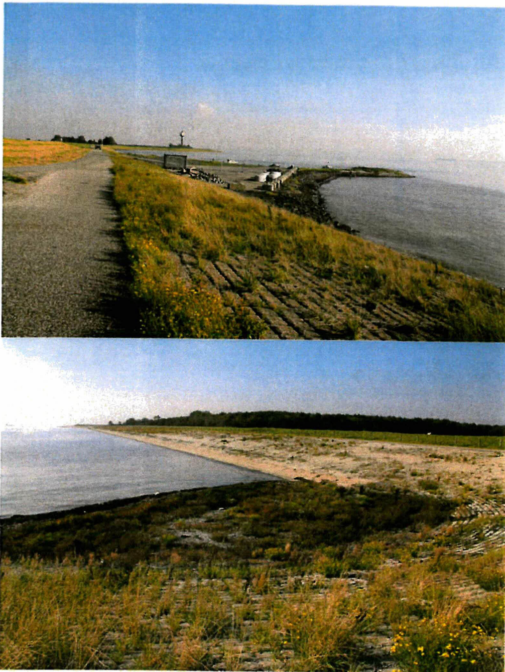
Figuur 1.3 Buitendijkse haven van Waarde en stenige hoekje ter hoogte van dp 184 - 187 (gelegen buiten projectgebied)