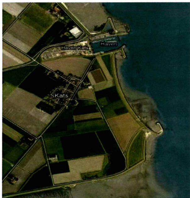
Figuur 1: Luchtfoto Leendert Abrahampolder dp 1729 – dp 1769

Een luchtfoto van het traject is weergegeven in figuur 1.