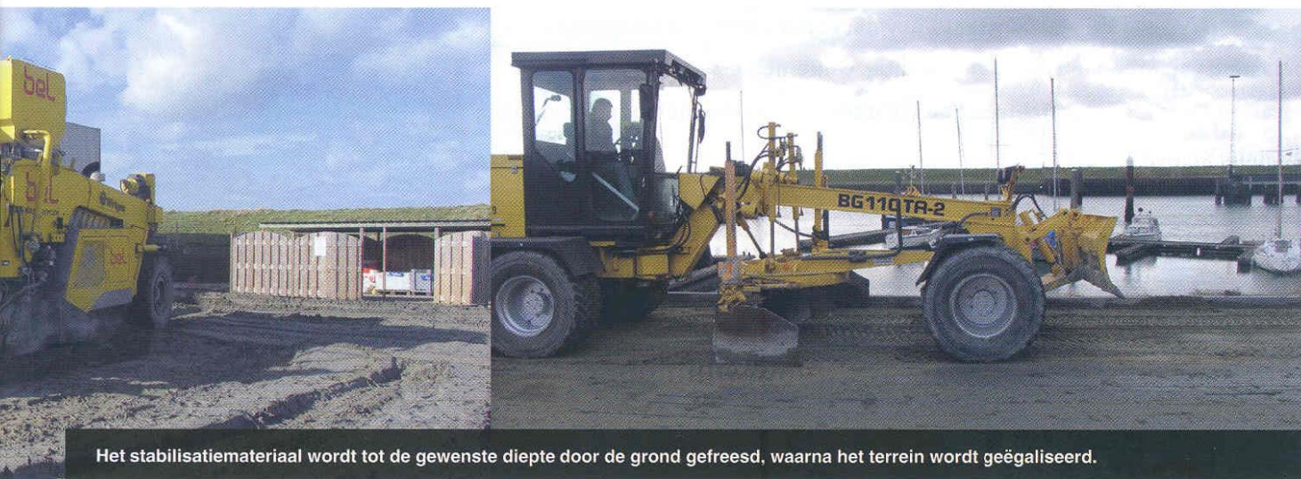
Het stabilisatiemateriaal wordt tot de gewenste diepte door de grond gefreesd, waarna het terrein wordt geëgaliseerd.