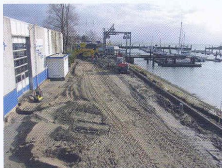
Het haverterrein is deel van de primaire waterkering langs de Oosterschelde.

Dit leidde tot de nodige problemen. De enorme freesmachine had meerdere malen moeite om rijdend te blijven. Voor soortgelijke klussen wordt in de toekomst dan ook een kleinere (niet zelfrijdende) frees ingezet. Ook het verdichten en profileren bracht de nodige problemen mee. Op de delen die droog waren, verliep het werk zeer voorspoedig. De natste delen van het terrein