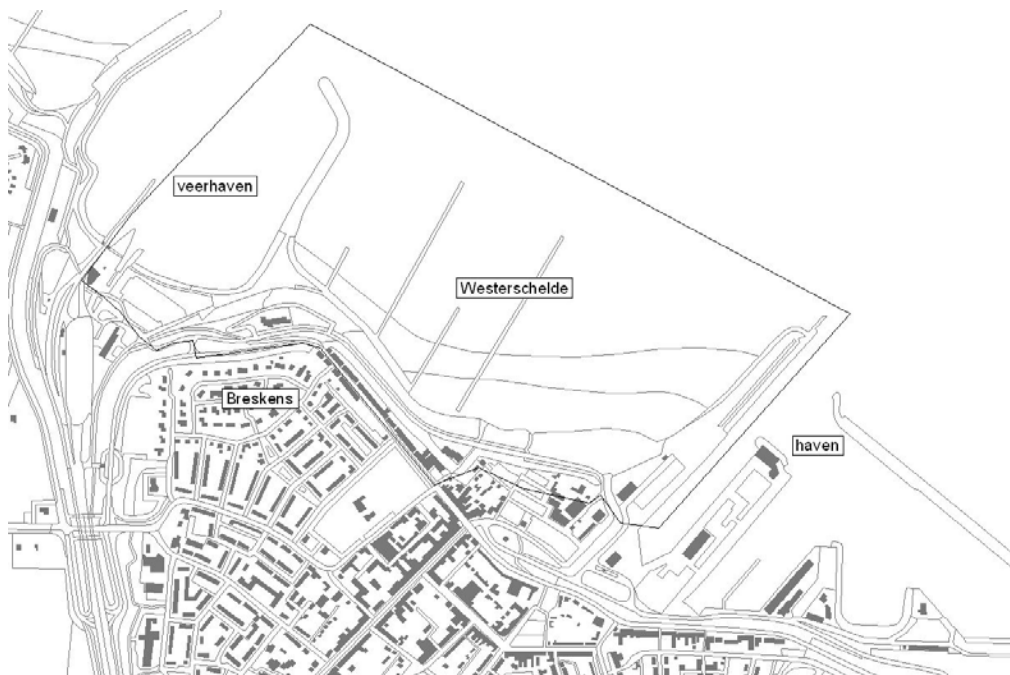
Figuur 4.7. Toponiemenkaart onderzoeksgebied.