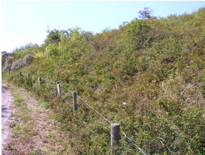
Figuur 4.4. Het duin begroeid met struweel, juli 2004.

Naast de haven met parkeerterrein bevindt zich een strand- en duingebied. In het onderzoeksgebied is de recreatiedruk vrij groot. In het gebied wordt veel gewandeld en in de zomer wordt er veel gezwommen. Vanaf het onbegroeide strand begint de begroeiing eerst met Helmgras en verder landinwaarts zijn de duinen begroeid met een door Duindoorn gedomineerd struweel. Boven op het duin bevindt zich een hotel en er loopt een weg van de veerhaven naar de stadskern van Breskens. Achter het duin begint de bebouwing van Breskens. Het oostelijke deel van het onderzoeksgebied wordt begrensd door de pier die de ingang vormt van de oostelijke haven. Hier bevinden zich enkele bedrijfsgebouwen.