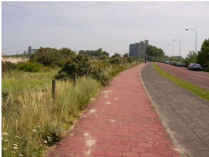
Figuur 4.5. De weg van de haven naar de dorpskern van Breskens, juli 2004.