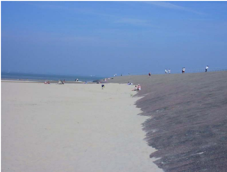
Figuur 4.6. De oostpier van de veerhaven aan de westzijde van het onderzoeksgebied, juli 2004.