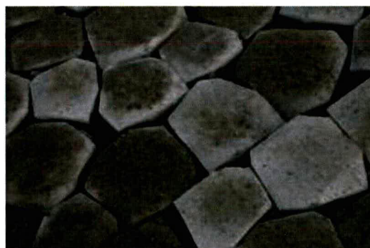
Aanzet strekdam en nieuwe dijkbekleding