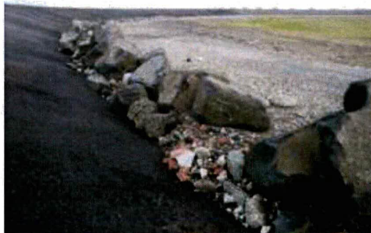
Roggenplaateland-west, binnen- en buitendijks