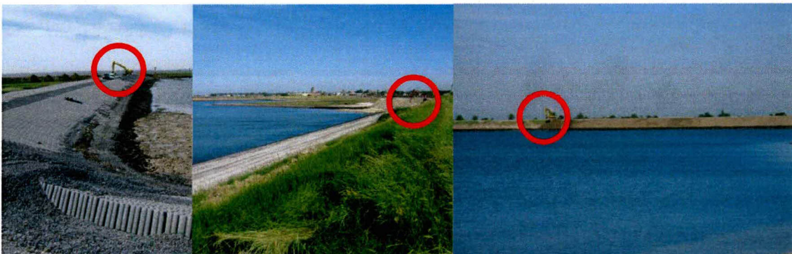
Figuur 2: Werkzaamheden vinden langs verschillende delen van de dijk plaats. Van links naar rechts: langs Haven de Val, langs de Gouweveerpolder en langs de polder Zuidhoek.

De werkzaamheden tussen dp 245 +50 meter en 248 +50 meter (inlaag Galgenpolder) en dijkpalen 255 en 261 +50 meter (schor 't Stelletje) zijn binnen bovenstaande tijdsbestek begonnen. Voor aanvang van het broedseizoen is begonnen met voorbereidende werkzaamheden langs de inlaag en het schor. Tijdens het veldbezoek vond nog steeds verstoring plaats door verschillende werkzaamheden voor deze delen.