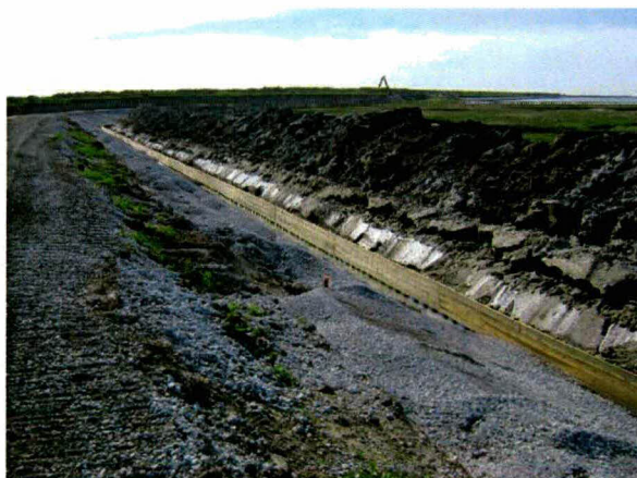
Figuur 1: Ontgraven dijkteen en werkstrook met zand op schor 't Stelletje.

De uitvoerder hield zich aan de breedte van de werkstrook. Alleen op het verhoogde schor en het onbegroeide deel van het schelpenstrandje aan de oostkant van schor 't Stelletje was de werkstrook breder. Dit is echter bij de provincie aangegeven (zie Toetsing aanpassing werkzaamheden).