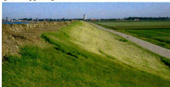
Figuur 3: Gemaaid buitentalud.

Verschillende delen van het dijktraject waren binnentaluds gemaaid ten tijde van het veldbzoek.