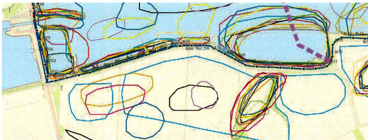
Figuur 1: HVP's ten westen van het dijktraject (eindigt bij paarse stippellijn). De cirkels geven de maandelijkse kartering van vogels bij hoogwater aan. Een hoge dichtheid van cirkels geeft aan dat een locatie een belangrijke functie heeft tijdens hoogwater (bijvoorbeeld het schor t.h.v. dp 1675-1679 en de kreek binnendijks).

Onderstaande tabel geeft het gemiddeld aantal vogels (periode 2006-2010) weer dat mogelijk verstoord wordt door een toename van wandelaars ten westen van het dijktraject. Hierbij zijn de vogels die als HVP gebruik maken van de sluis en van het schor langs het dijktraject niet meegenomen. De reden hiervoor is respectievelijk dat rond de sluis al veel verstoring door o.a. verkeer plaatsvindt en verstoring van HVP's ter hoogte van het schor al zijn meegenomen in de Passende Beoordeling.