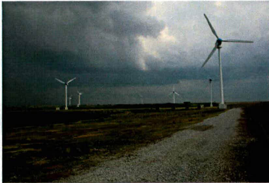
Foto 1.2 Verharde weg onderaan de dijk

Het eiland bestaat grotendeels uit zandgronden met een schrale vegetatie. In het westelijk deel bevindt zich spontaan ontwikkeld duinstruweel, in het oostelijk deel enig aangeplant struweel. Open water ontbreekt. Fietsers en ander autoverkeer doorsnijden het eiland over de N57, waardoor ze de dijken en het eiland niet verstoren.