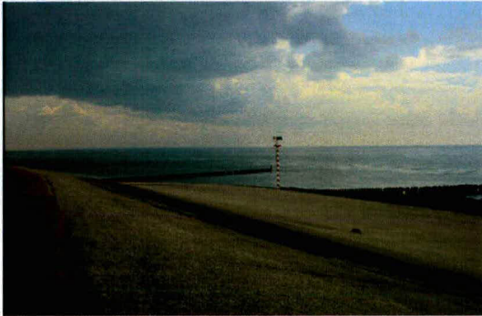
Foto 2.1 De asfalt beklede dijk

In de huidige situatie is via een werkweg/parallelweg langs de N57 de Noordzeezijde vrij toegankelijk. De Oosterscheldezijde is vanaf de N57 bereikbaar, maar afgesloten met een slagboom. Benedendijks ligt een verharde weg. De kruin is bekleed met asfalt.