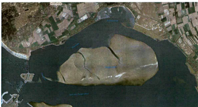
Foto 1.1 Roggeplaat

Aan de Oosterscheldezijde ligt op ongeveer een kilometer afstand de Roggeplaat, een zandplaat welke overstroomt bij hoge waterstanden. De plaat is een van de twee zandplaten langs de zuidkant van Schouwen-Duiveland en de grootse zandplaat in de Oosterschelde. Op de Roggeplaat bevindt zich de Westgeul (aan de westzijde) en de Oliegeul (aan de oostzijde).