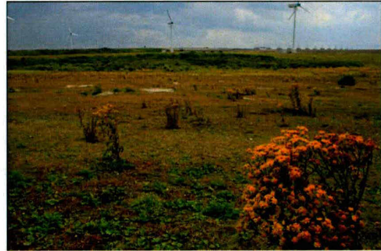
Foto 1.3 Noordzeezijde van Roggeplaat