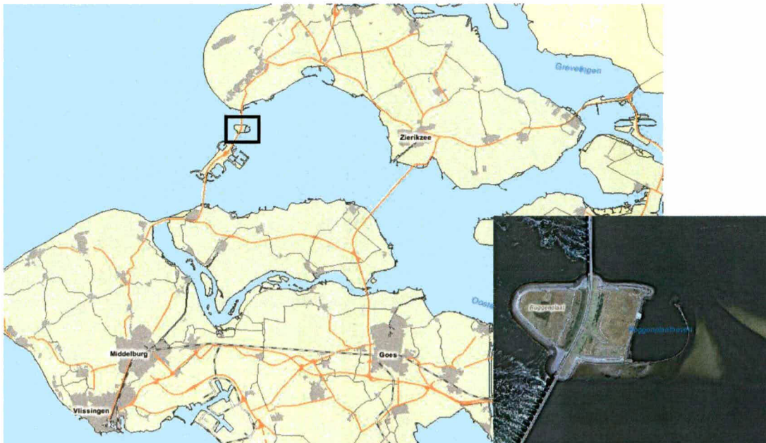
Figuur 1.1 De ligging van het dijktraject Roggenplaateland (geoweb Provincie Zeeland)