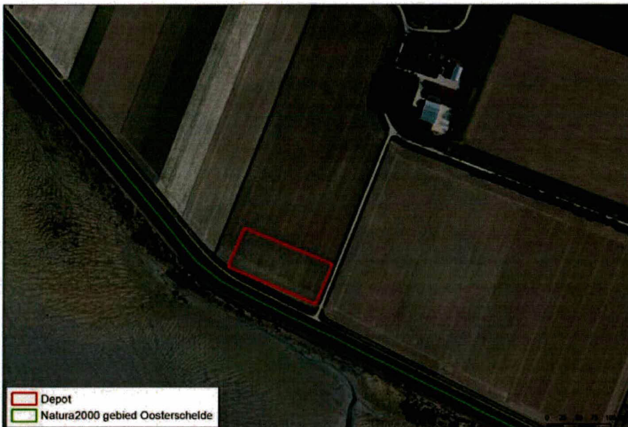
Figuur 2: luchtfoto van de depotlocatie. Tevens begrenzing van Natura 2000-gebied Oosterschelde.