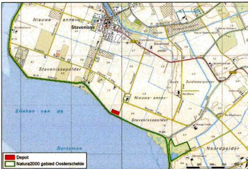
Figuur 1: locatie van het depot en de begrenzing van het Natura 2000-gebied Oosterschelde.

Voor het wettelijke kader van de Natuurbeschermingswet 1998 wordt verwezen naar deel B van de Natuurbeschermingswetvergunning (Provincie Zeeland, 2011).