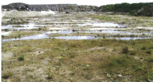
Afbeelding 1: deel van het depot geschikt voor Rugstreepad.

Vorig jaar zijn maatregelen genomen om waterplassen op te heffen. Met name rond het depot dat in gebruik is, zijn de waterplassen verdwenen. Ook in het zuidelijke deel van het depot zijn de grote waterplassen verdwenen. Alleen in de diepere delen, die zijn ontstaan door het rijden met zwaar materieel is water aanwezig.