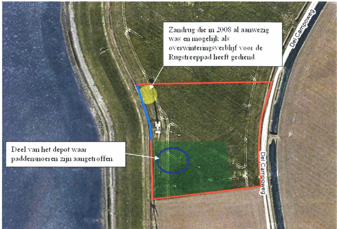
Afbeelding 4: Depot (rood) met paddenscheren (turkoois) en potentieel voortplantingsgebied van de Rugstreepad (groen).