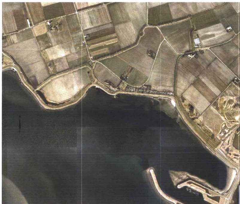
Figuur 1: Luchtfoto Klaas van Steeland-, Poortvliet- en Schakerloopolder (Tholen 2) dp 1043 – dp 1080

Een luchtfoto van het traject is weergegeven in figuur 1.