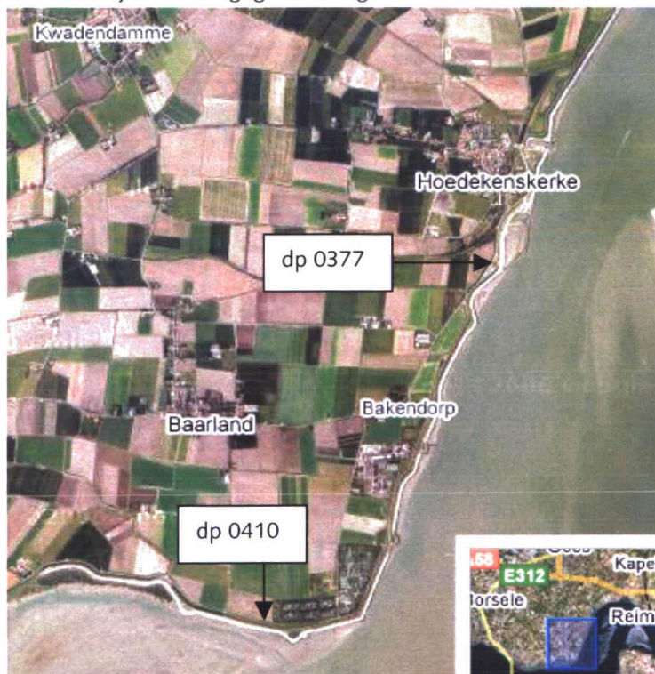
Figuur 1: Luchtfoto Baarlandpolder dp 0377 – dp 0410

Een luchtfoto van het traject is weergegeven in figuur 1.