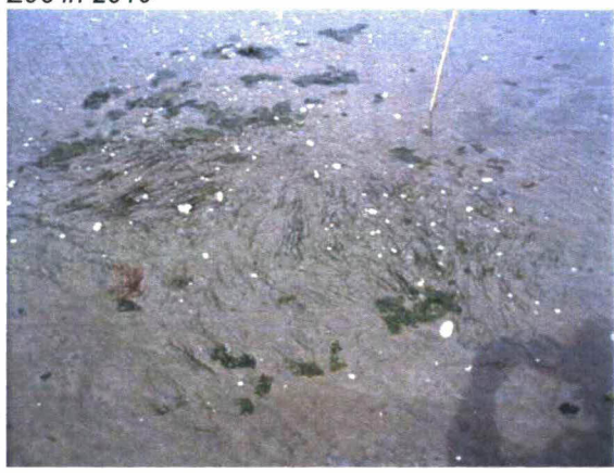
Z15 in 2010 (1.5 m 2 )