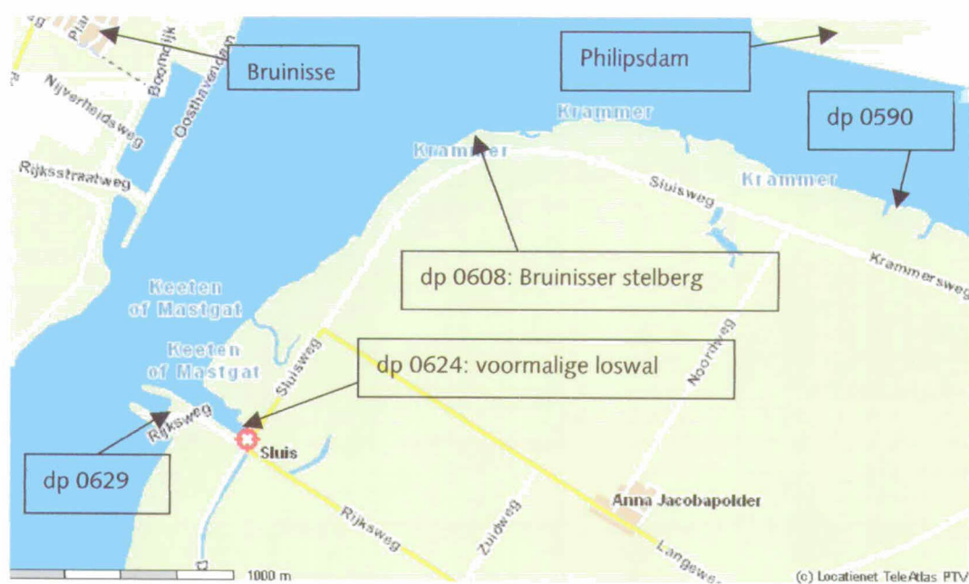
Figuur 1: Kaart Anna Jacobapolder dp 0590 – dp 0629

In dit erratum staan enkele tekstuele wijzigingen. Daarnaast komen de kopjes "Vrijgave" en "Opmerkingen" in het basisdocument te vervallen en worden zij vervangen door de tekst uit dit erratum.