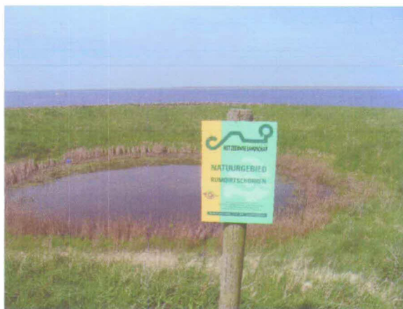
Figuur 2: Holle stelle (Bruinisser stelberg) bij dp 0608

Toen de bevolking in de Zeeuwse delta vanaf het jaar 1000 begon toe te nemen, concentreerden de bewoners zich vooral om de holle stellen. Een en ander is door archeologisch onderzoek in oude dorpskernen aangetoond.