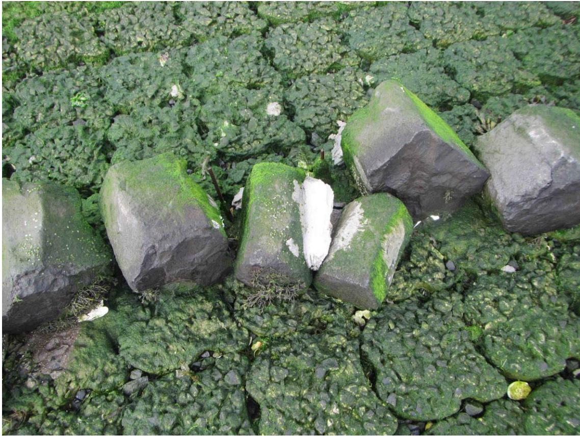
Specie bevestiging en losliggende zuilen