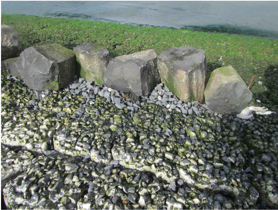
Steenslag ophoping boven zuilen