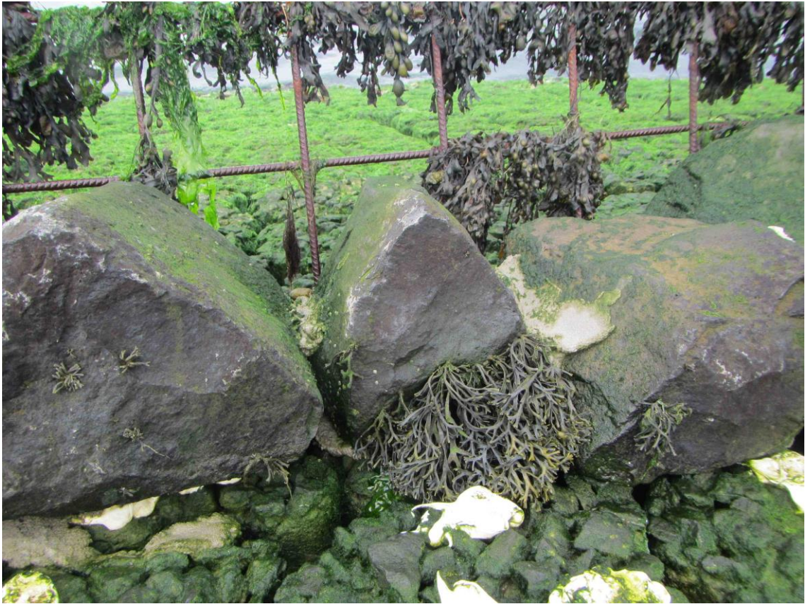
Zuilen in bocht met extra steun van betonijzer