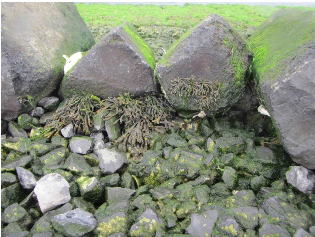
Groefwier zuil met steenslag