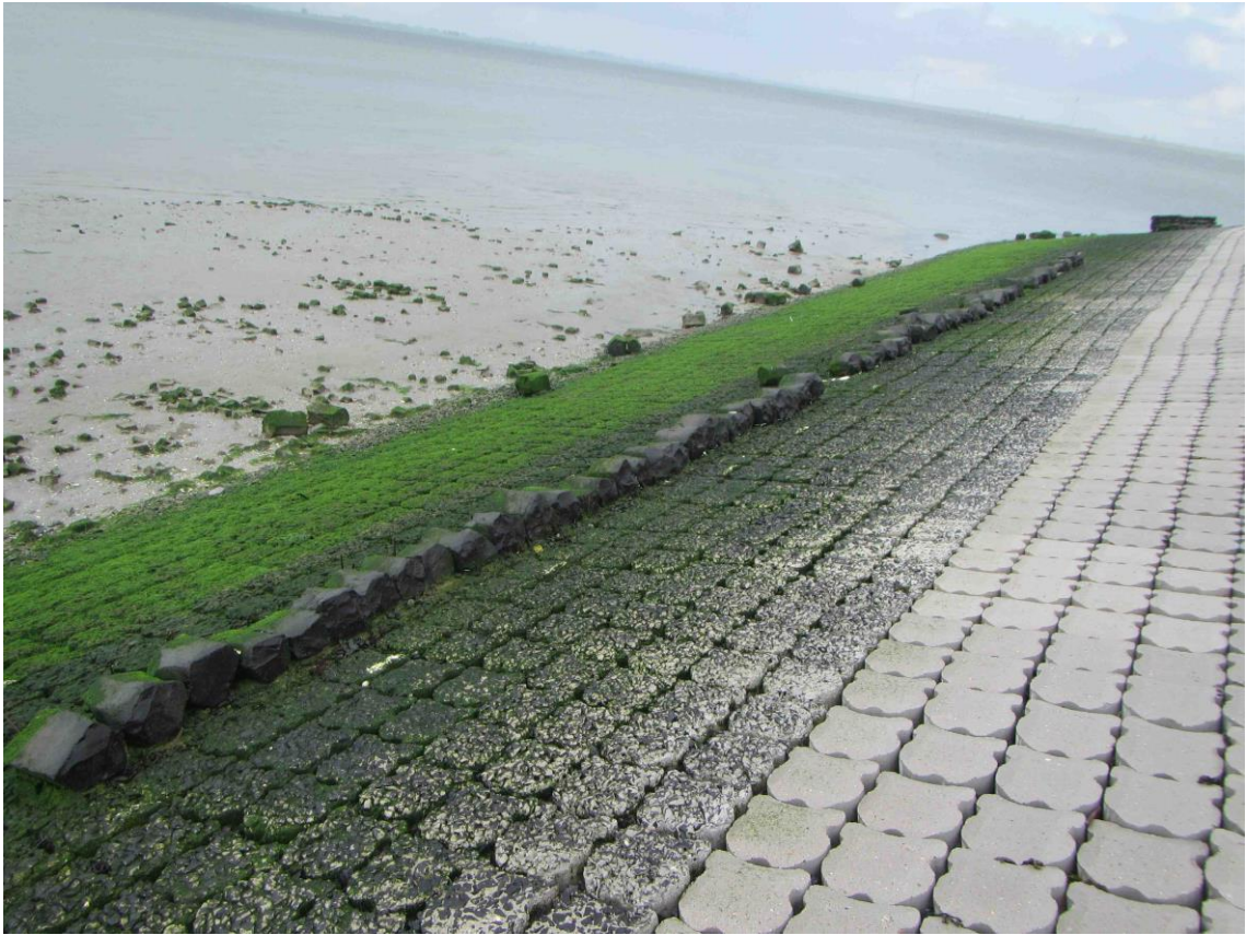
Traject voor de bocht. Onder: detail zuil met groefwier