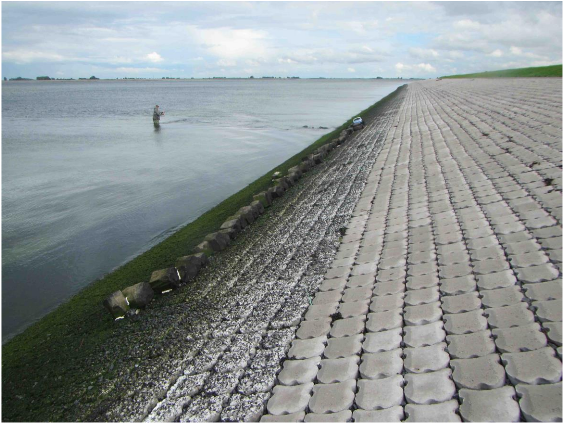
Traject bij strekdam. Onder: nieuw functie zuilen als steun voor visspullen.