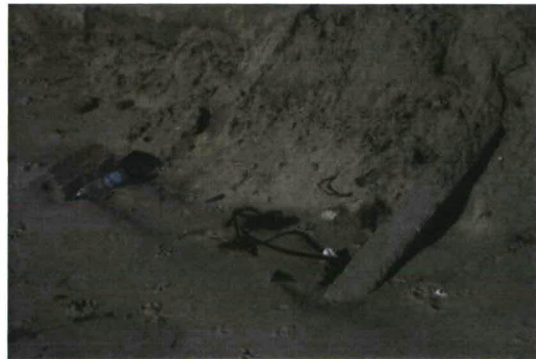
Teruggeplaatst duinzand bij Sloedam / betonpaal achtergebleven in het zand