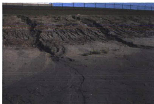
Rijshoutscherm Sloedam – Kaloot / uitspoeling dijklichaam Van Citters