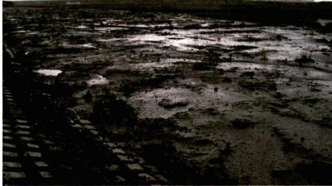
Reliëf ontstaan in nieuwe schorbovengrond door getijdewerking