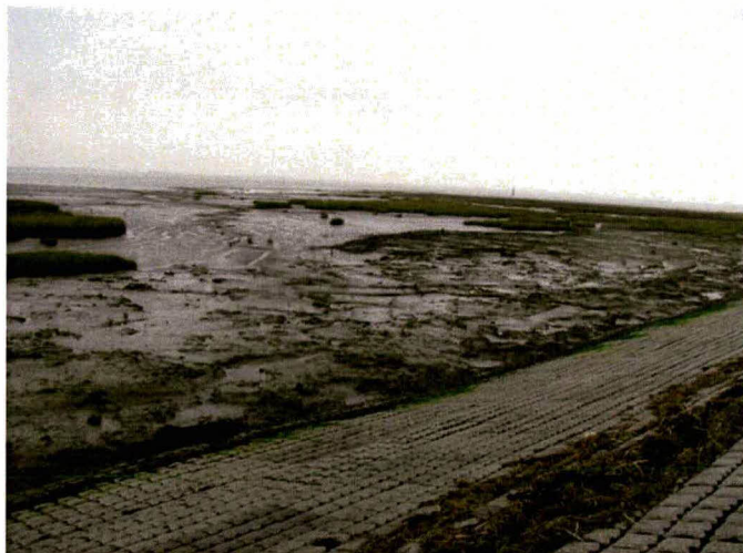
Locatie voormalige uitwateringssluis

In de nieuwe bovengrond ter plaatse van de werkstrook zorgen de eb- en vloedbewegingen inmiddels voor het ontstaan van nieuwe structuren zoals kleine geulen. De verwachting is dat het slik / schor binnen één seizoen weer begroeid zal raken.