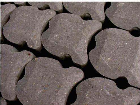
Nog aan te vullen betonzuilen