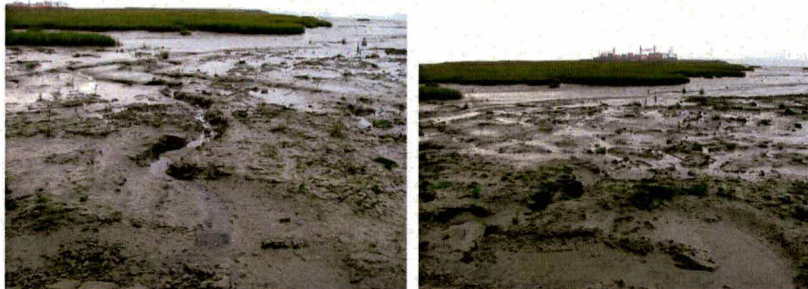
Microgeultjes tijdens afgaand water