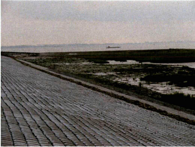
Dijkbekleding van betonzuilen, met behoud van de basaltzuilen in ondertafel