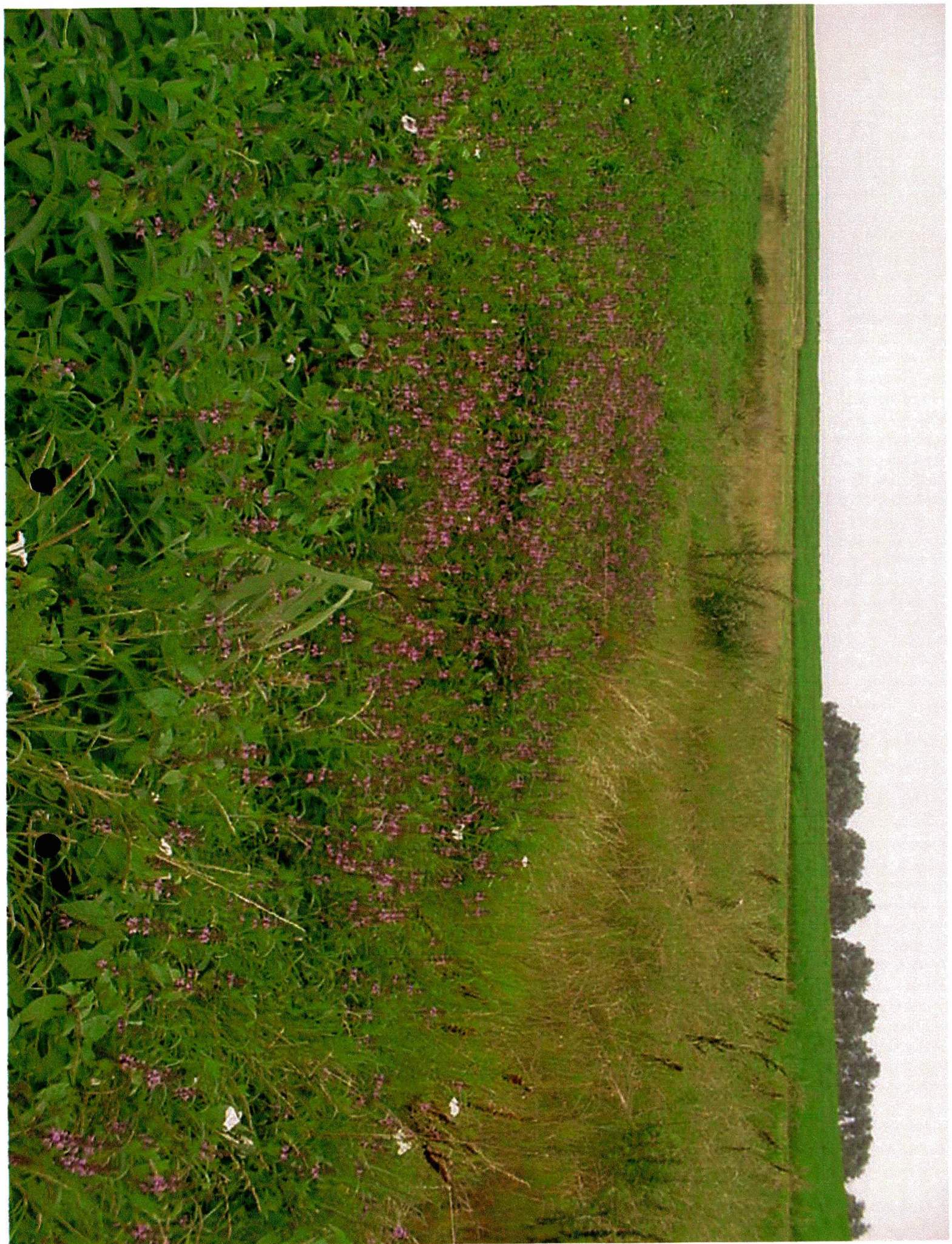
Reigersbergse polder 27-8-2000