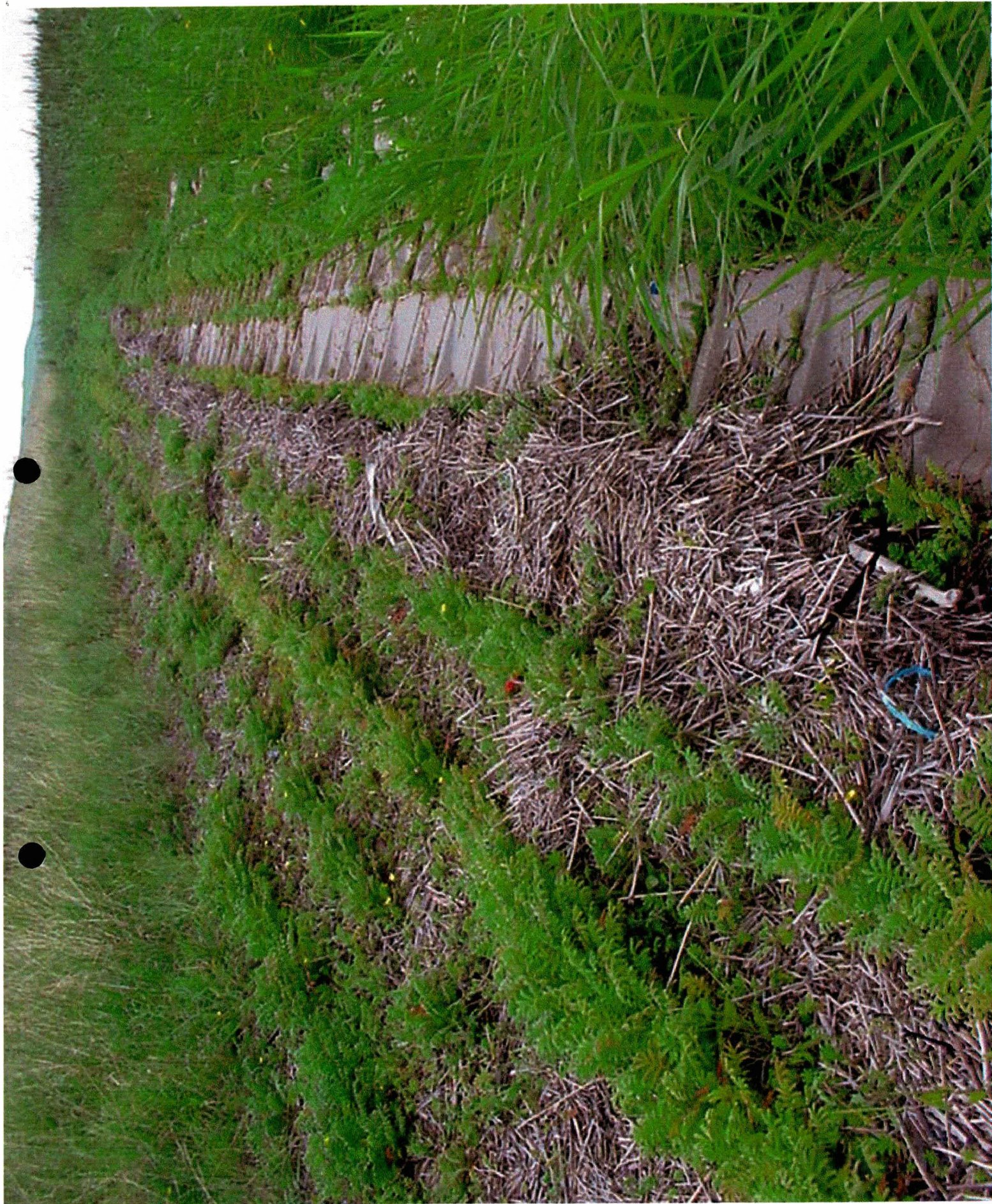
Foto 1 Reigersbergse polder 27-8-2000 Riërschor, veek, zilverschoon, strandkweek.