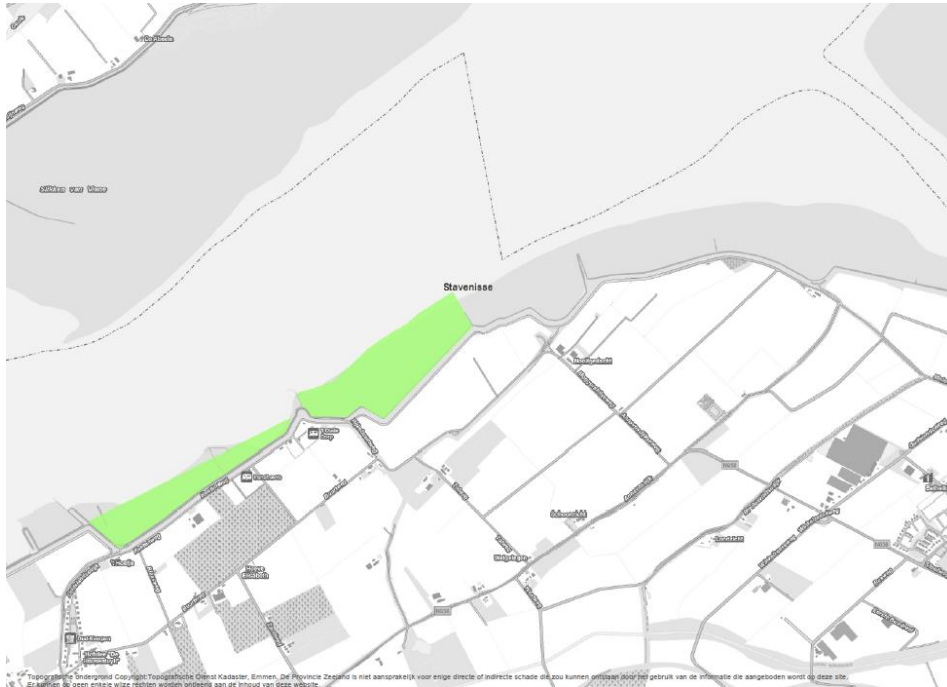
Abbeelding a2, officiële spitlocatie nummer 9