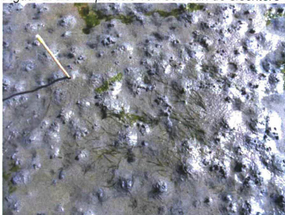
Z06 in 2009