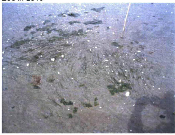
Z15 in 2010 (1.5 m 2 )