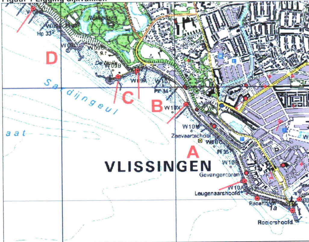
Figuur 1 Ligging dijkvakken