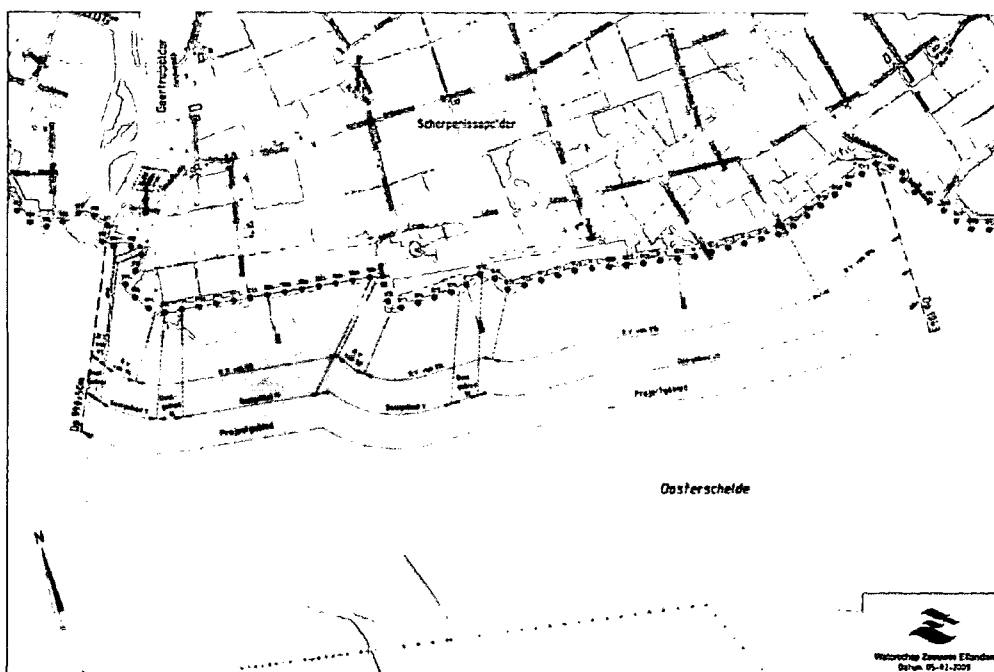
Figuur 1 Projectgebied met indeling deelgebieden

Deelgebied I: (dp 990 – dp992): huidige situatie vlakke betonblokken en systeem Leendertse in slechte staat.