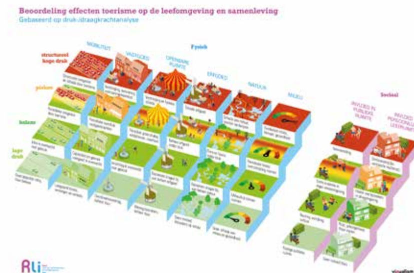
Raad voor de leefomgeving en infrastructuur. (2019). 'Waardevol toerisme, de leefomgeving verdient het'.