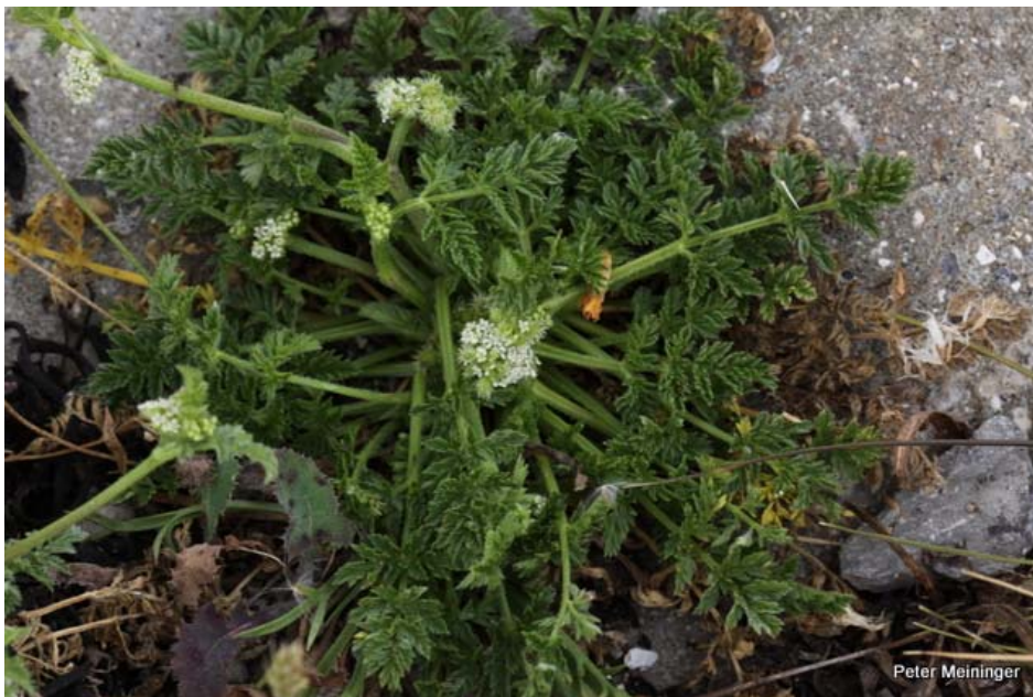
Landbouwhaven Kats, Zandkreek-Noord, Noord-Beveland. Knopig doornzaad, met succes tijdelijk in depot gezet. Foto: augustus 2012.