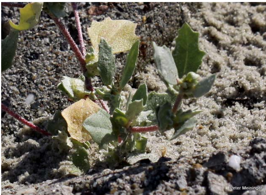
Zeedijk Thoornpolder, Noord-Beveland. Gelobde melde tussen de betonzuilen. Uitvoering 2007. Foto: juli 2012.