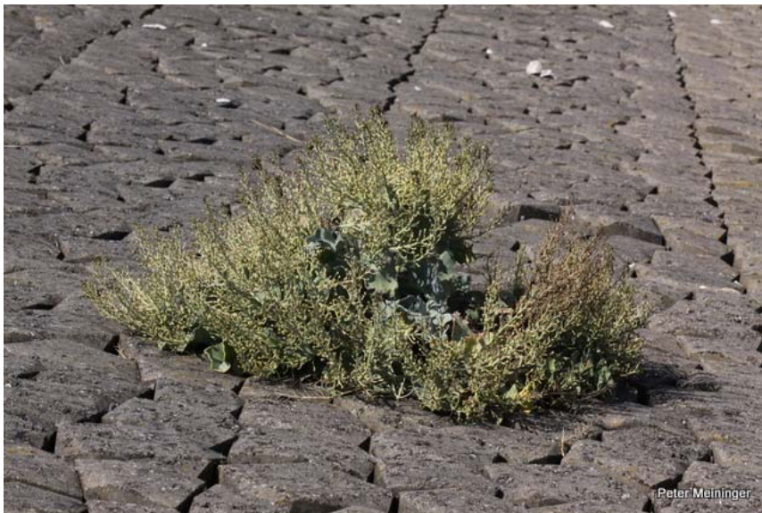
Zeedijk Keihoogte, Noord-Beveland. Zeekool. Uitvoering in 2007. Foto: augustus 2012.