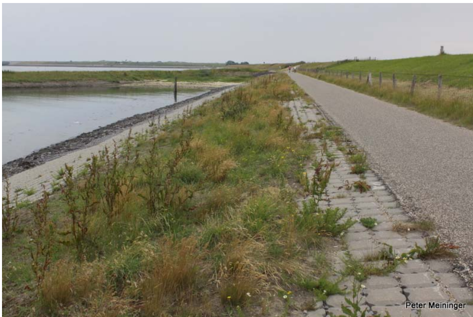
Zeedijk Burgh- en Westlandpolder, Schouwen-Duiveland, in de luwte van de Westbout. Uitgevoerd in 2008 en afgestrooid met kleirijke grond. Foto: juli 2012.