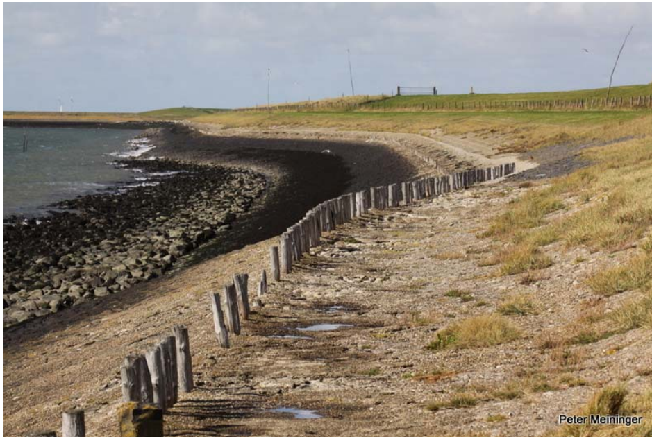
Oosterschelde bij Zuidhoekinlagen, Schouwen-Duiveland. Oude zeedijk met diverse bekledingstypen, perkoenpalen en zoutminnende planten. Foto: oktober 2012.