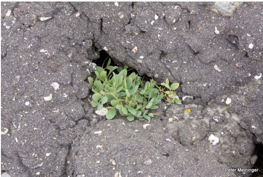
Schelphoek, Schouwen-Duiveland. Zeelathyrus tussen breuksteen en gietasfalt,. Foto: augustus 2012.