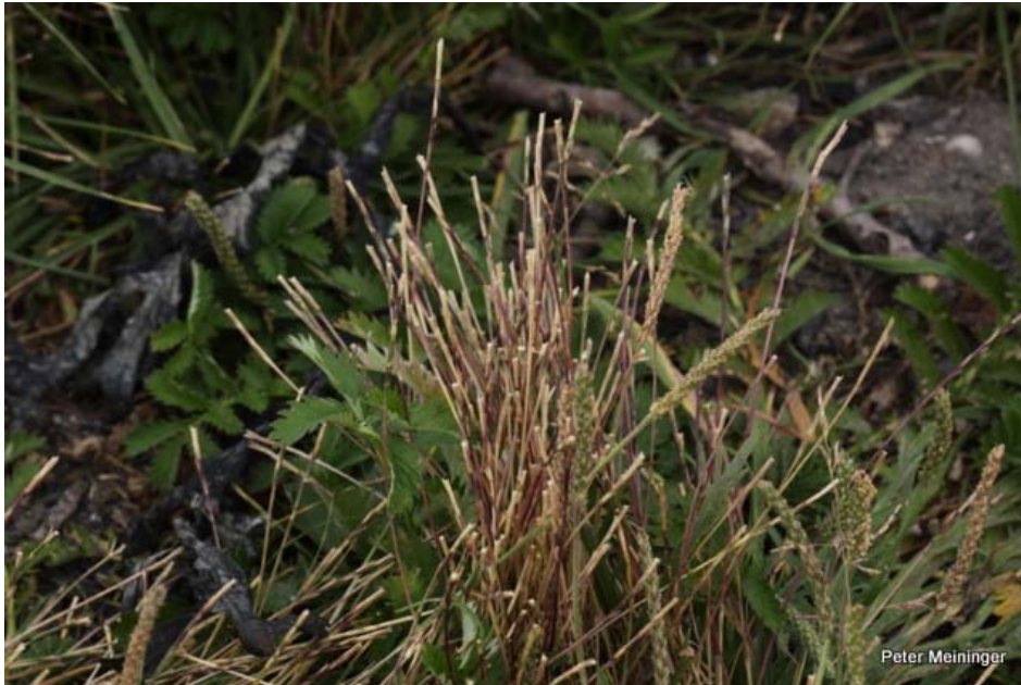
Landbouwhaven Kats, Zandkreek-Noord, Noord-Beveland. Het wat onooglijke gras Dunstaart, met succes tijdelijk in depot gezet. Foto: augustus 2012.