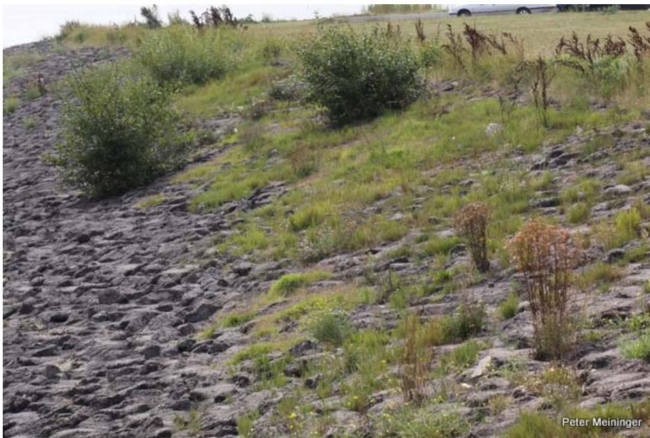
Zeedijk Grevelingendam. Uitgevoerd in 2009. Zelfs breuksteen met gietasfalt is hier al opmerkelijk gevarieerd begroeid. Luw gelegen met een voorland van slik. Foto: juli 2012.