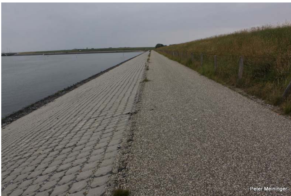
Zeedijk Burgh- en Westlandpolder, Schouwen-Duiveland, richting Oosterscheldekering. Uitgevoerd in 2008. Door het ontbreken van luwte nog vrijwel onbegroeid. Foto: juli 2012.