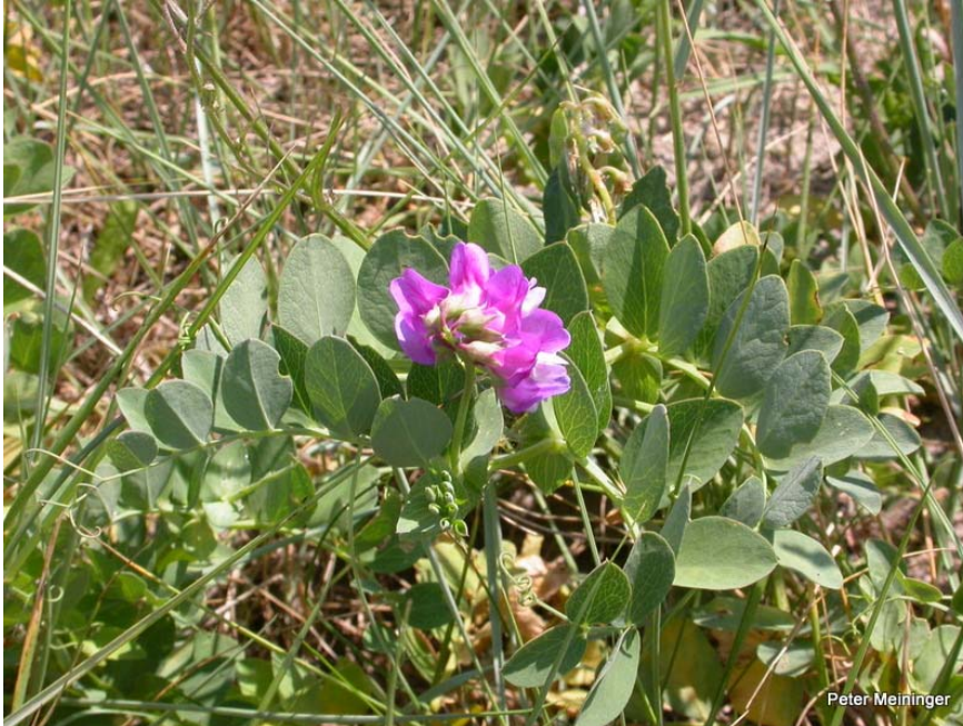
Noord-Beveland. Zeelathyrus op (thans verdwenen) groeiplaats. Foto: juli 2006.