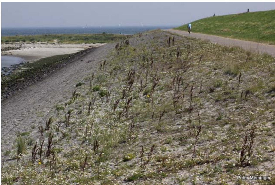
Zeedijk Thoornpolder, Noord-Beveland. In de luwte van de Westnol met opgewaaid zand groeien veel bijzondere planten. Uitgevoerd in 2007. Foto: juli 2012.