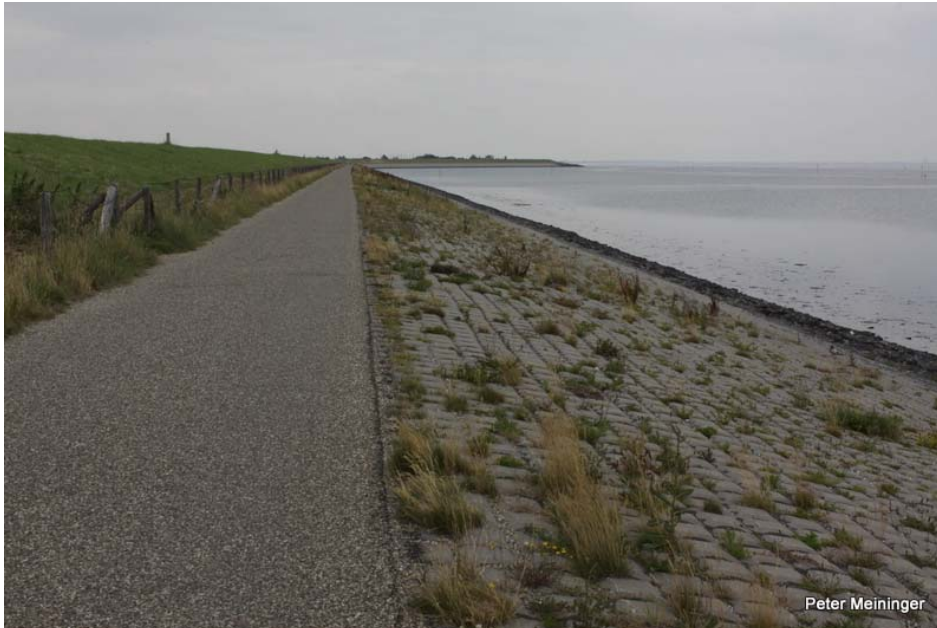
Zeedijk Burgh- en Westlandpolder, Schouwen-Duiveland, in de luwte van de Westbout. Uitgevoerd in 2008 en afgestrooid met beetje zand. Foto: juli 2012.