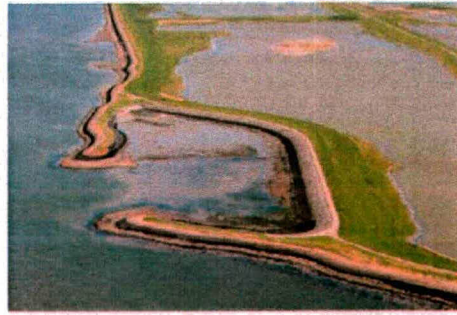
Figuur 1.2. Dijkval tijdens laag- en hoog water. Strandje aan de westkant valt droog.