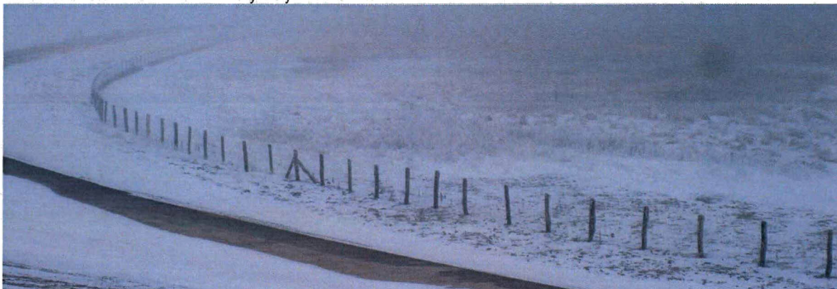
Schor aan de westkant van het dijktraject in 2013.