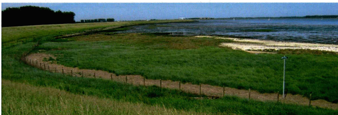
Schor aan de westkant van het dijktraject in 2009.

Schor en slik is na de werkzaamheden op dezelfde hoogte teruggebracht als voor de werkzaamheden. Zie voor de situatie op het schor de volgende foto. Aan dit voorschrift is voldaan.