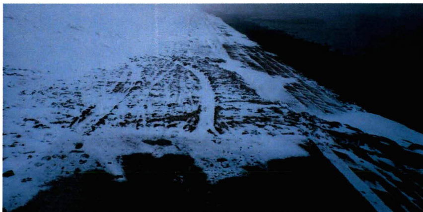
Eind van het fietspad en t.h.v. dp 1679.