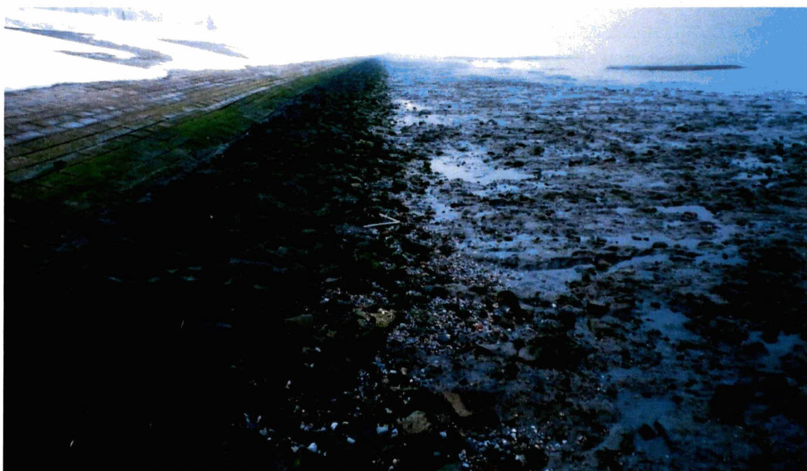
Werkstrook ter hoogte van dp 1633 in 2013.

Als het voorland uit slik en/of schor bestaat: Als op het voorland in de werkstrook in de huidige situatie stenen op het slik of schor liggen, registreren van deze situatie vóór de werkzaamheden (fotograferen en beschrijven). Naar gelang de mogelijkheden, na afloop de grond en stenen zo egaal mogelijk verdelen, maar de situatie mag niet verslechteren ten aanzien van de huidige situatie.