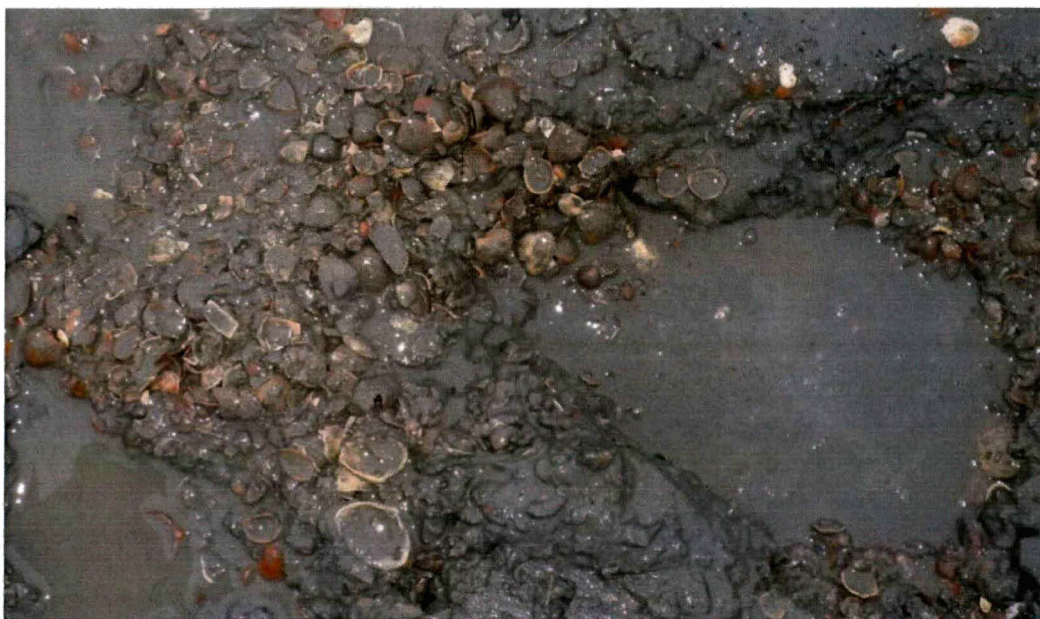
Schelpen onder het slik.

Tussen dijkpalen 1634 en 1638 dient aansluitend aan de dijkverbetering een laag van 7 à 10 cm gebiedseigen schelpen in de werkstrook te worden aangebracht, zodanig dat deze door een laag van 7 à 10 cm sediment bedekt wordt. Na de werkzaamheden zijn schelpen aangebracht tussen bovenstaande dijkpaalnummers. Op onderstaande foto zijn de schelpen zichtbaar wanneer in het slik gegraven wordt. Aan dit voorschrift is voldaan.