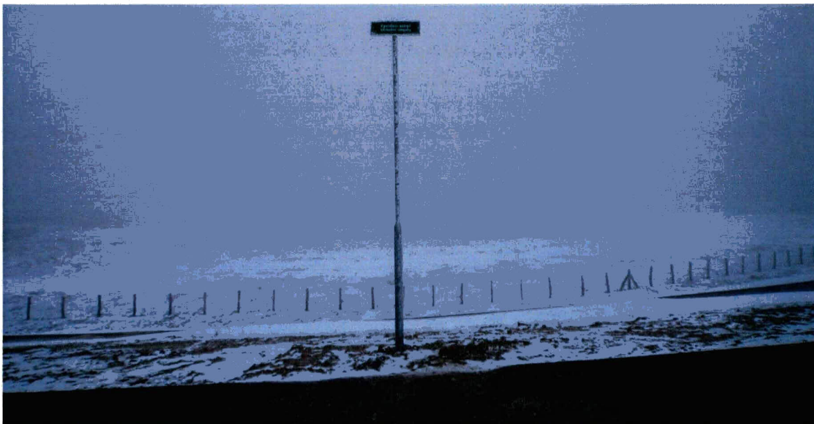
Bebording en afrastering ter hoogte van het schor aan de westkant van het dijktraject.

Tussen dijkpalen 1634 en 1638 dient aansluitend aan de dijkverbetering een laag van 7 à 10 cm gebiedseigen schelpen in de werkstrook te worden aangebracht, zodanig dat deze door een laag van 7 à 10 cm sediment bedekt wordt. Na de werkzaamheden zijn schelpen aangebracht tussen bovenstaande dijkpaalnummers. Op onderstaande foto zijn de schelpen zichtbaar wanneer in het slik gegraven wordt. Aan dit voorschrift is voldaan.