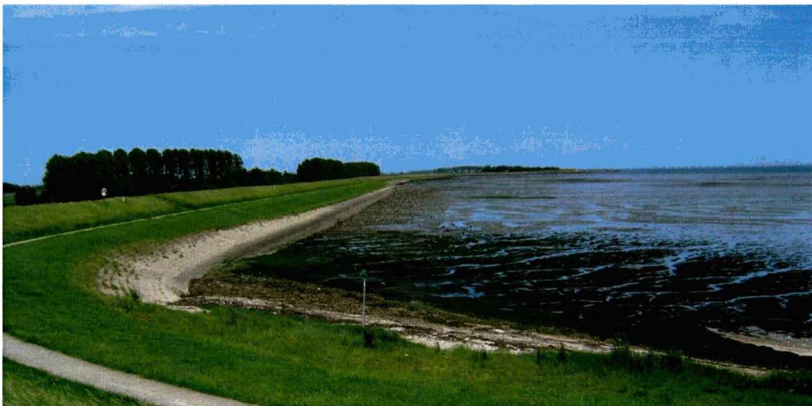
Situatie aan de westkant van de dijk in 2009.