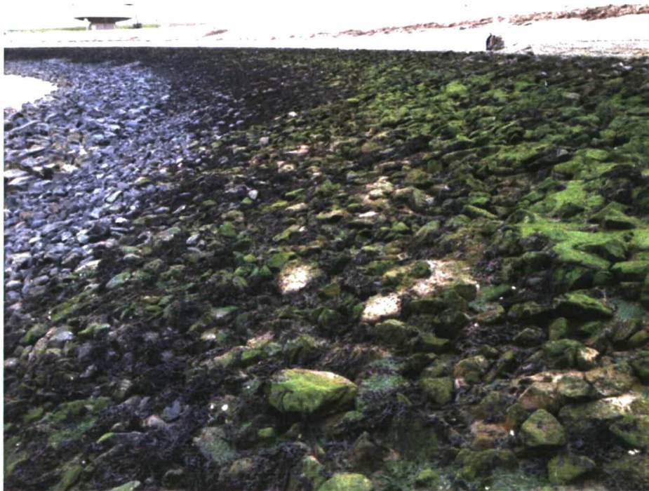
Foto 1.2. Gemengde begroeiing met Blaaswier en darmwieren.