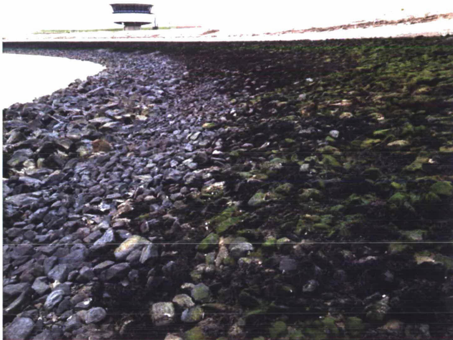
Foto 1.3. Veel losse breuksteen en steenslag onderaan glooiing, onbegroeid.