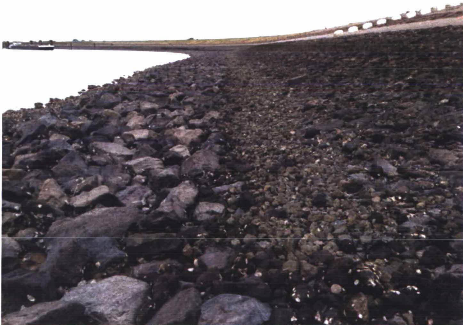
Foto 3.4. Strook losse stenen (gebroken beton) onderaan glooiing, onbegroeid.