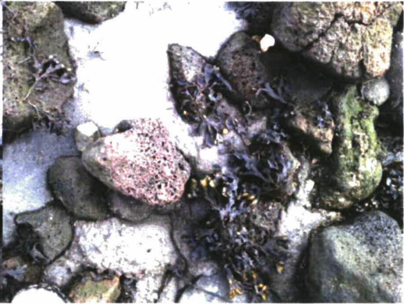
Foto 2.6. Bovenaan, spaarzaam Kleine zee-eik op lavasteen