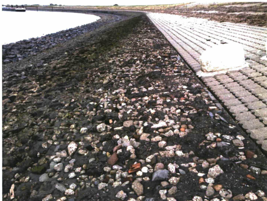
Foto 3.2. Bovenste strook is onbegroeid. Daaronder groenwier en open begroeiing met Blaaswier.