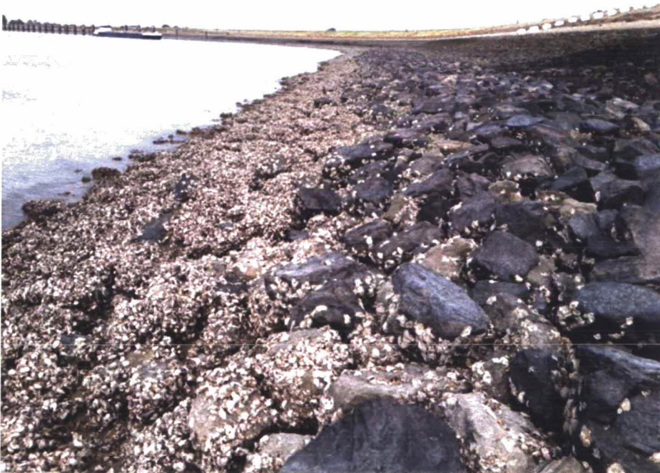
Foto 2.9. Kreukelberm van grotere breuksteen, gedomineerd door Japanse oester.