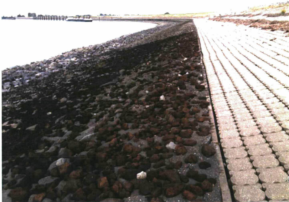
Foto 2.1. Bovenste zone met lavasteen is onbegroeid.