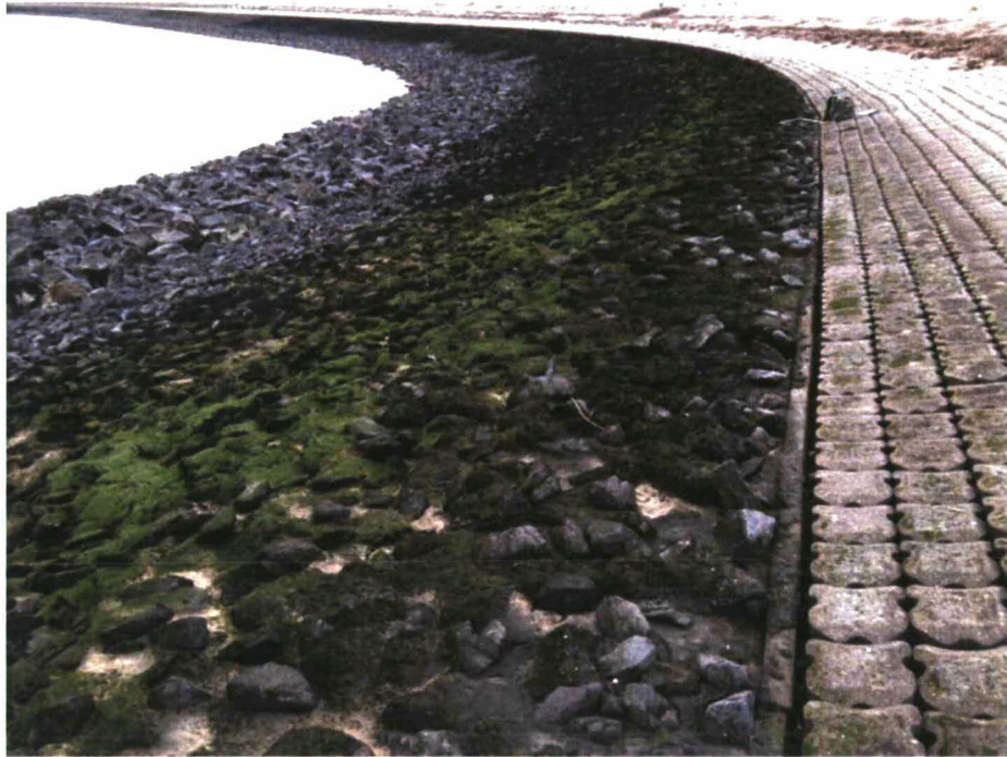
Foto 1.1. Overzicht proefvak 1.