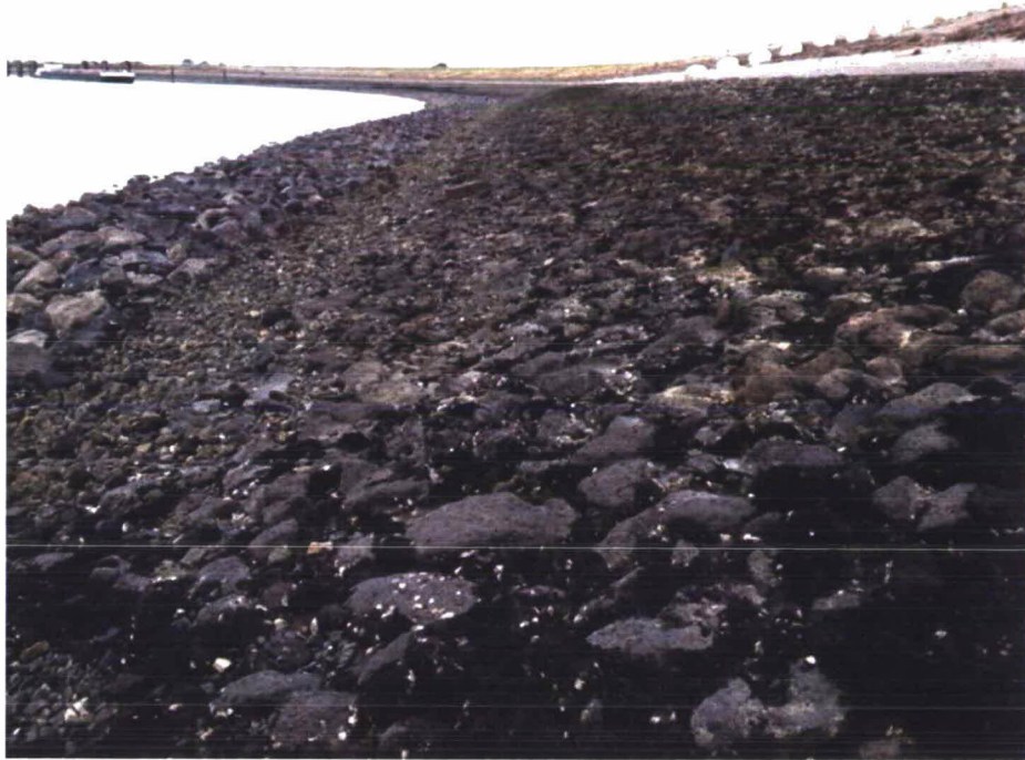
Foto 3.3. Voorgrond begroeiing proefvak 2, achtergrond kaler proefvak 3.