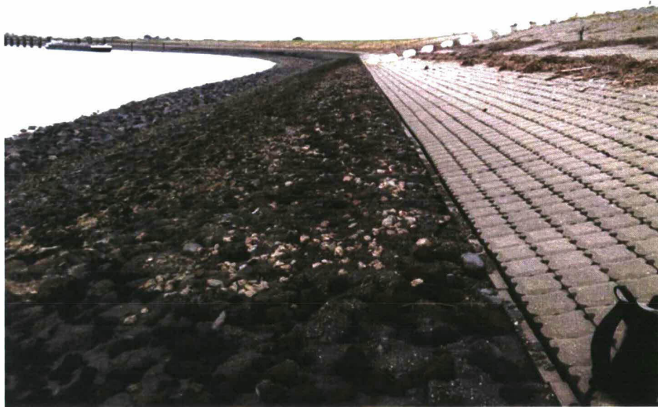
Foto 3.1. Overzicht proefvak 3.