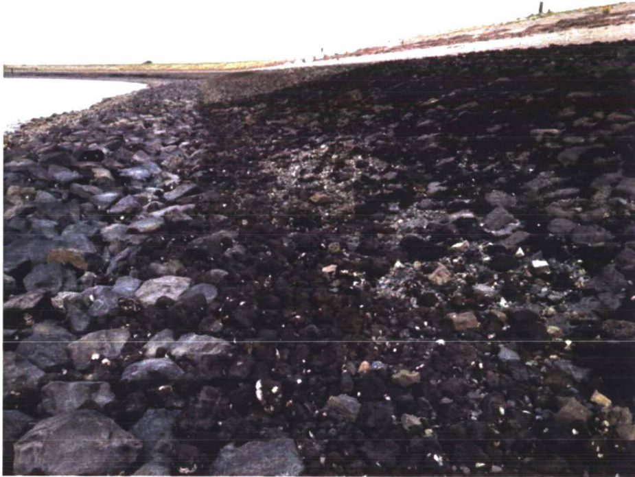
Foto 2.8. Onderaan talud veel losse lavasteen en lokaal ook veel steenslag.