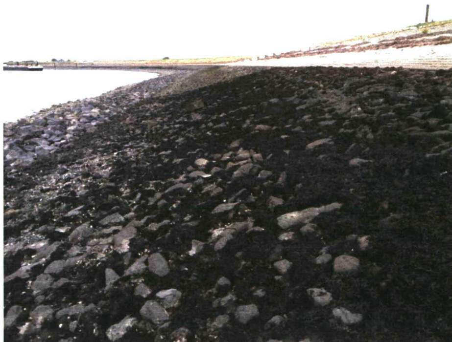
Foto 2.2. Zone met Blaaswier. Bedekking variabel.