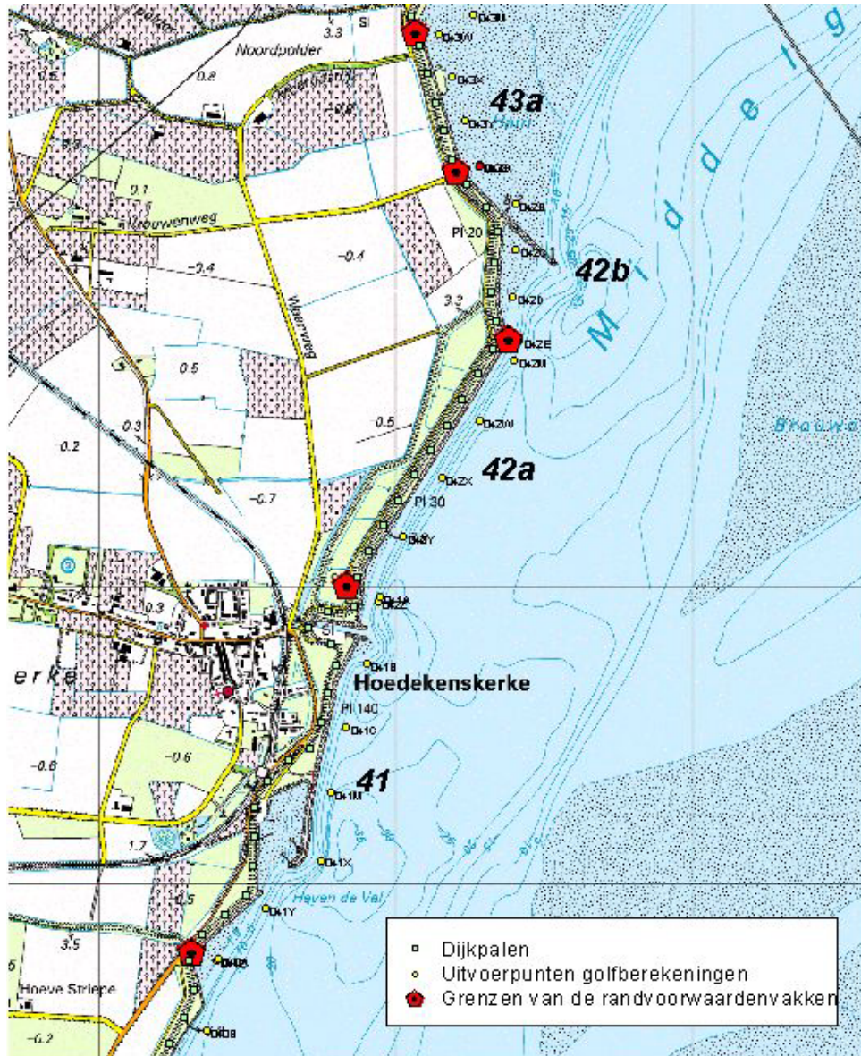
Bijlage 2 : topografisch kaartje, met de ligging van de grenzen