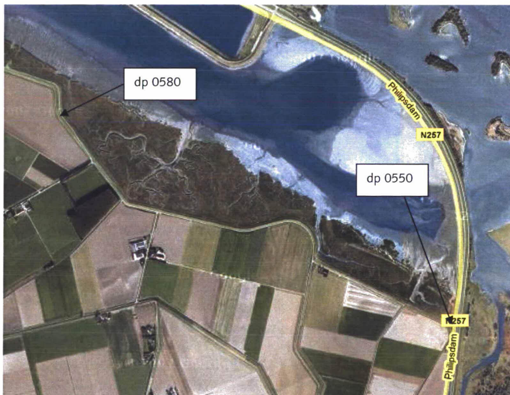
Figuur 1: Luchtfoto Anna Jacobapolder, Prins Hendrik Kramerpolder

Een luchtfoto van het traject is weergegeven in figuur 1.