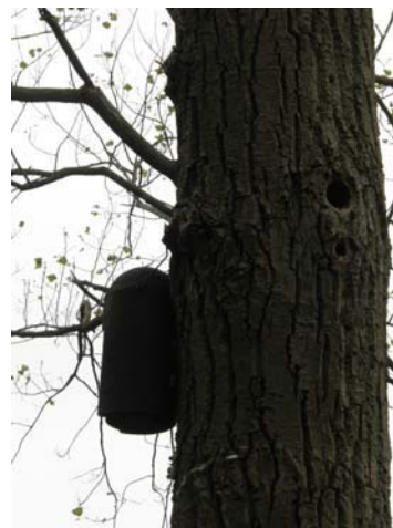
Vleermuiskast met uitwerpselen, waarschijnlijk van Watervleermuis