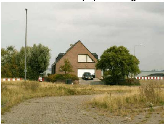
Huis op het noordelijke deel van het veerplein met verblijfplaats van Gewone dwergvleermuis en waarschijnlijk Laatvlieger.