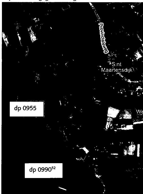
Figuur 1: Luchtfoto Noord-, Oudeland-, Muije- en Pluimpotpolder (Tholen 1) dp 0955 – dp 0990 52

Een luchtfoto van het traject is weergegeven in figuur 1.