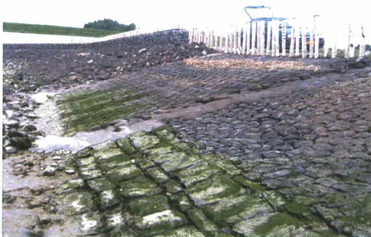
Figuur 4-2 Proefvak in juni 2008.