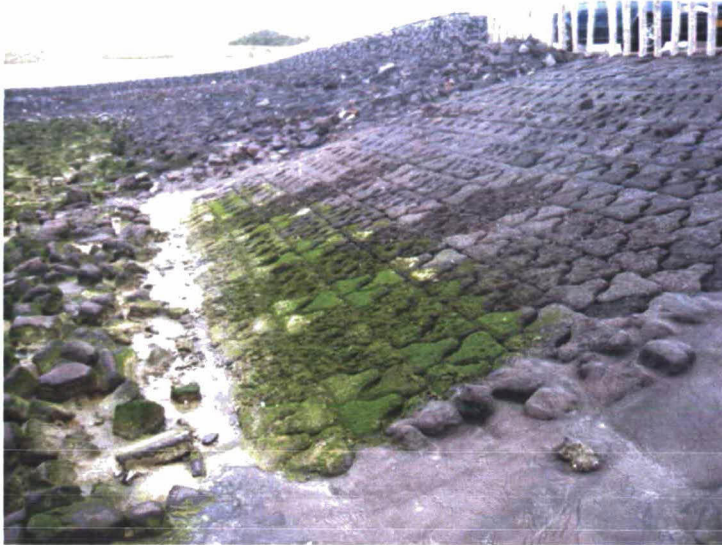
Figuur 4-3 Proefvak in augustus 2008