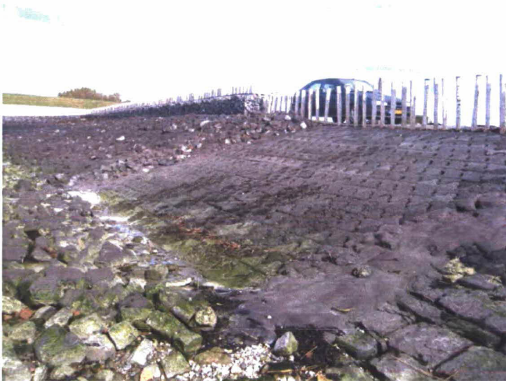
Figuur 4-4 Proefvak in oktober 2008.