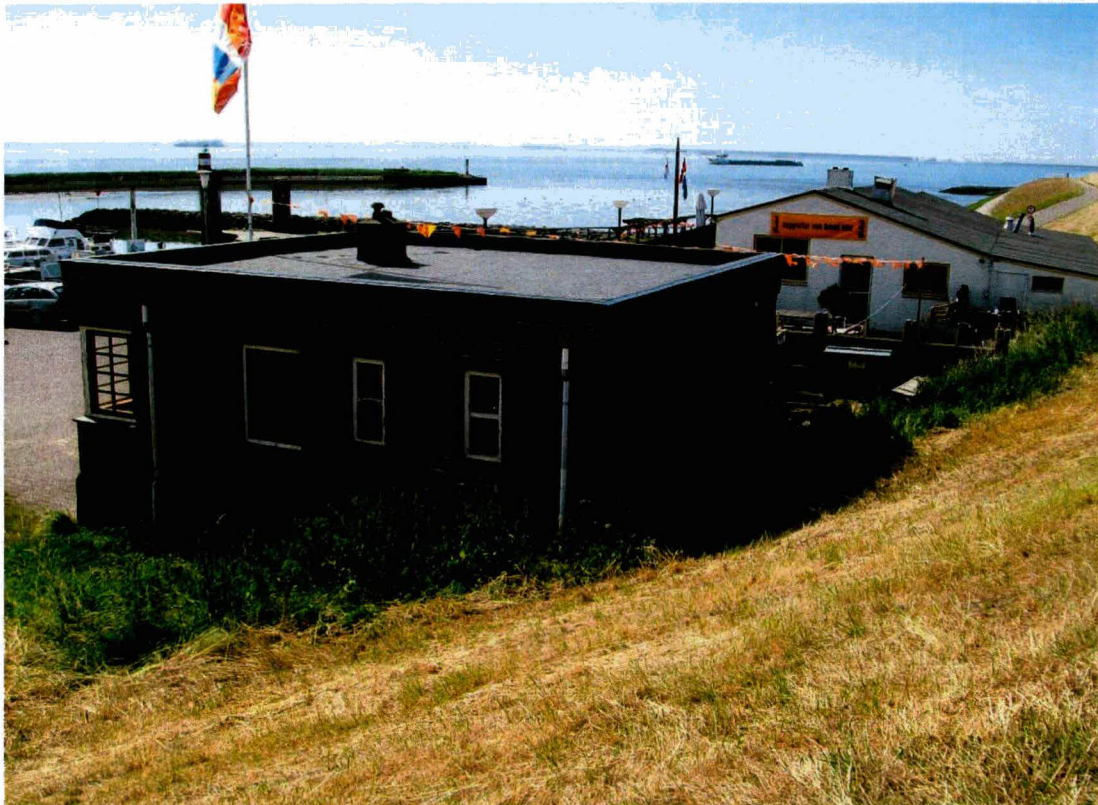
Boven: westgevel in dijkvoet