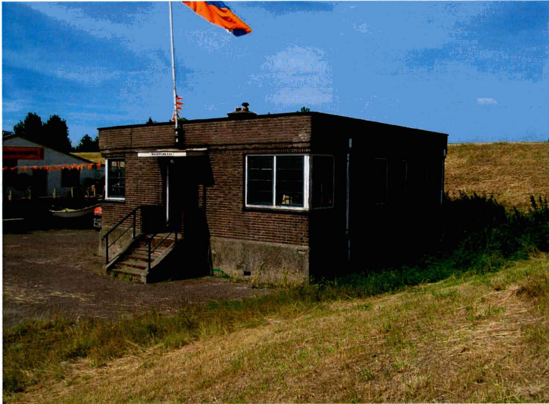
Boven: oostgevel met entree