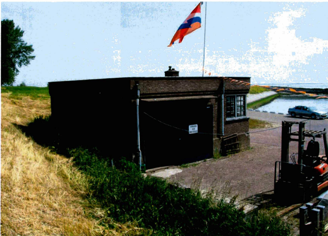
Onder: zuidgevel met loodsdeur