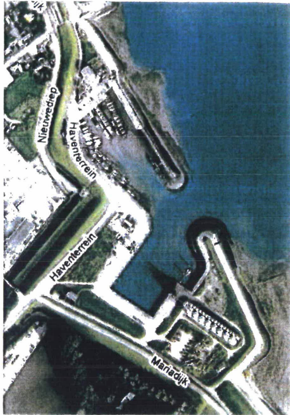
Figuur 1: Luchtfoto traject Havendammen Walsoorden