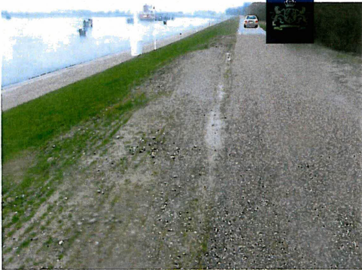
Steenslag / slakken in berm ter plaatse van tijdelijke dijkovergang