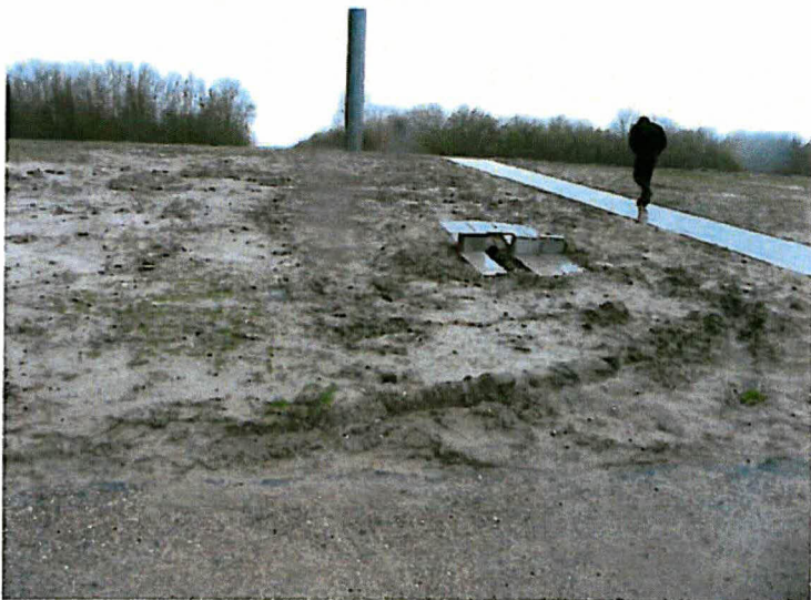
Situatie rondom pellicht