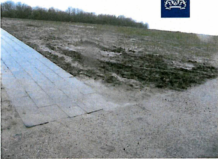
Situatie rondom pellicht