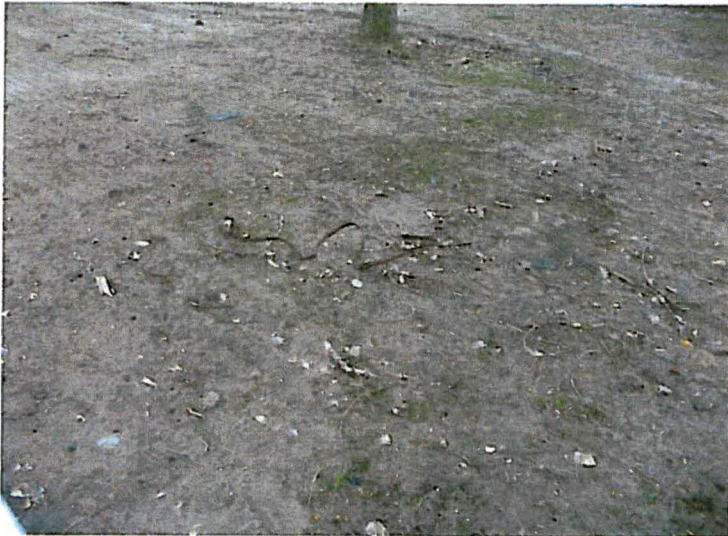
Achtergebleven binddraad in grondwerk