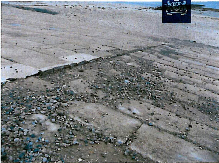
Houten damwand steekt boven de glooiing uit