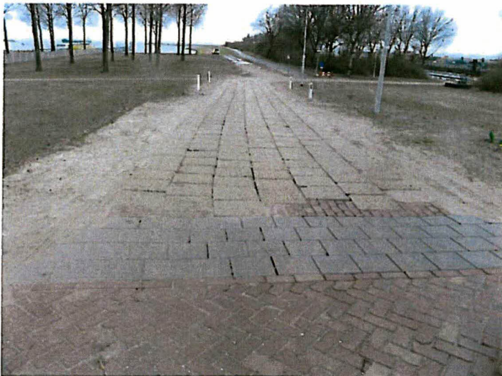
Kierende verharding van betonblokken