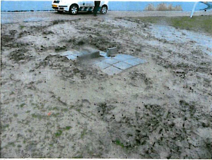
Uitmonding drainagebuis pellicht