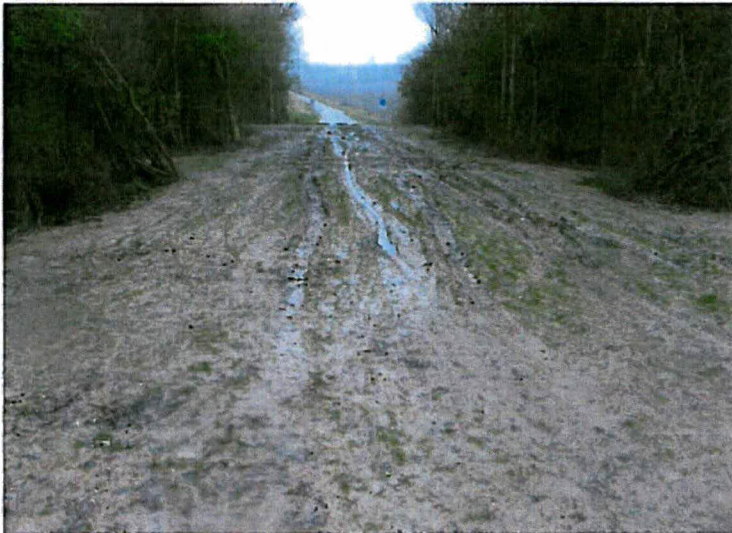
Sporen in grondwerk ter plaatse van tijdelijke dijkovergang.