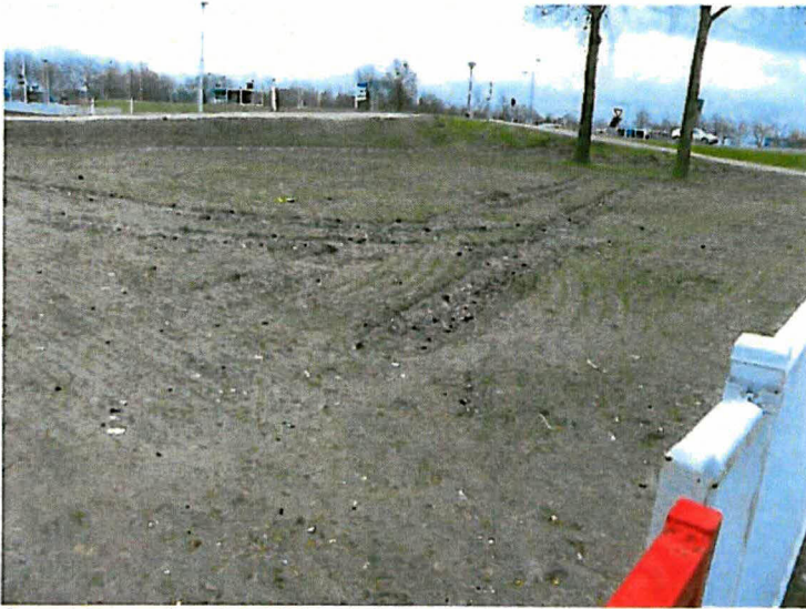
Sporen grondwerk middensluis