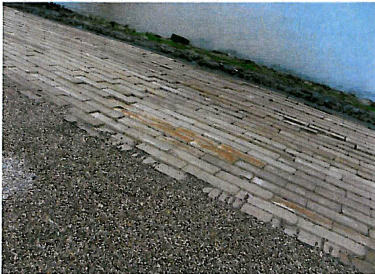
Verzakking aan de Oosthavendijk