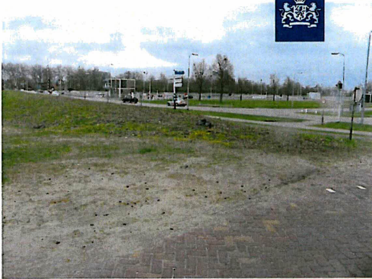
Steenresten in het grondwerk