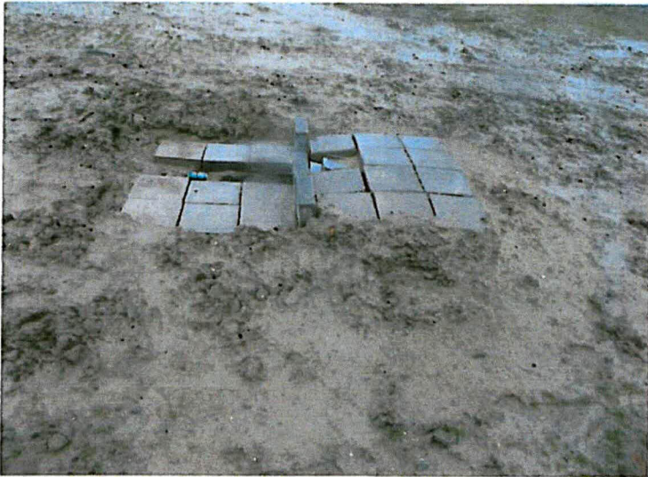
Uitmonding drainagebuis pellicht