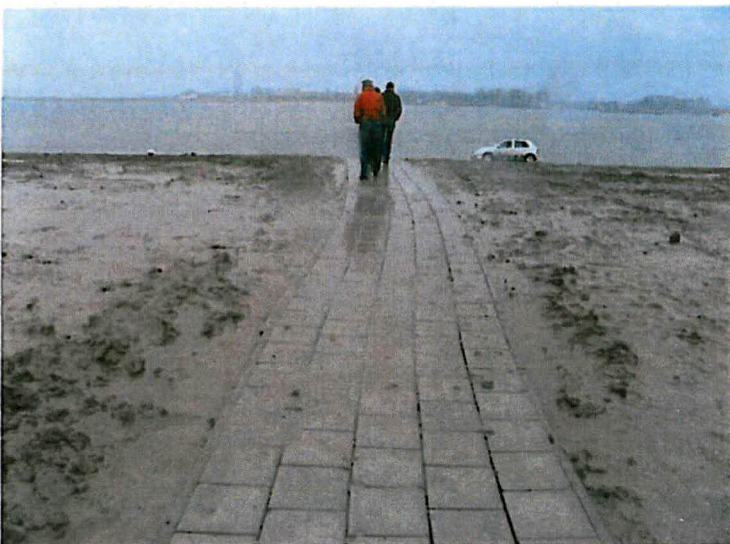
Situatie rondom pellicht