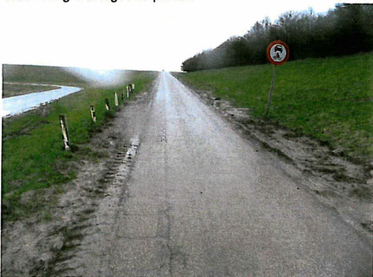
Bermen langs dijkovergang