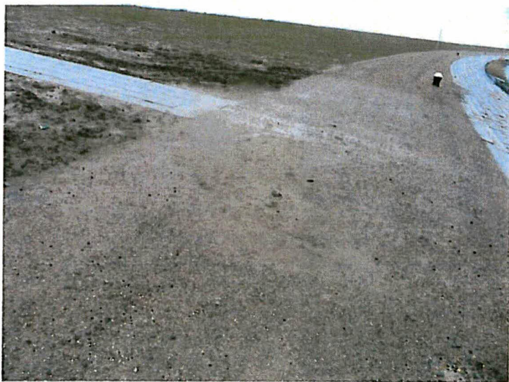
Situatie rondom pellicht