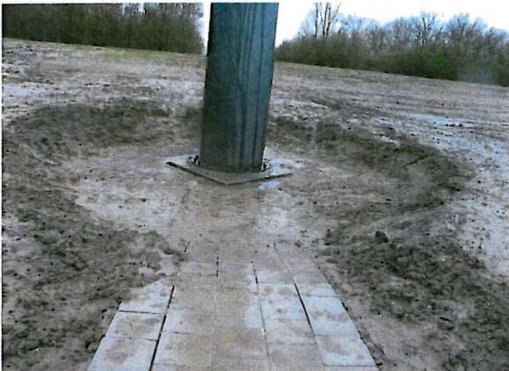
Situatie rondom pellicht