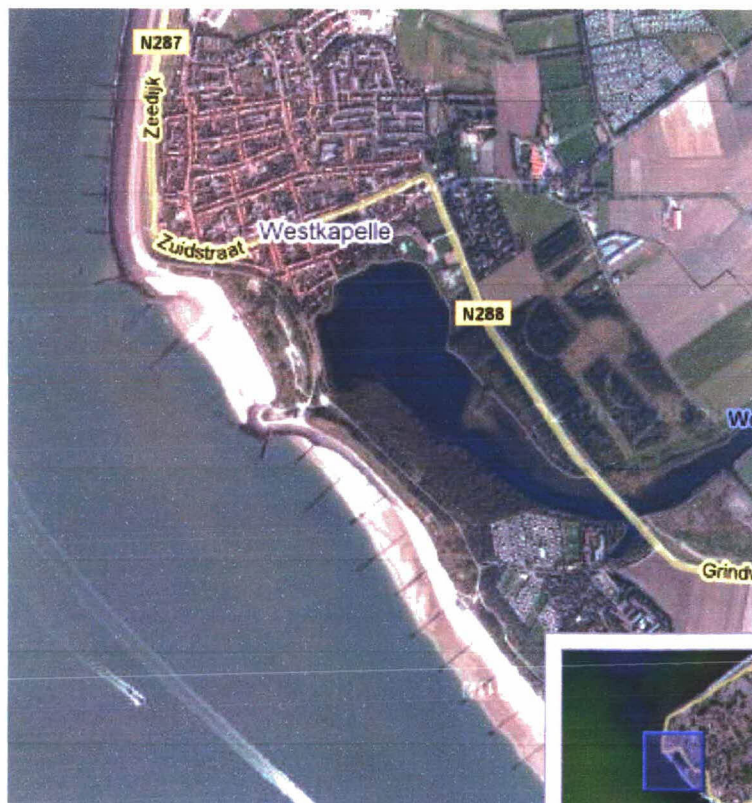
Figuur 4: Luchtfoto Gat van Westkapelle dp 0211 – dp 0225