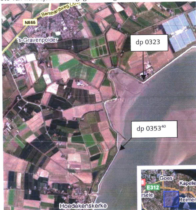
Figuur 1: Luchtfoto Biezelingsche Ham dp 0323 – dp 0353 40

Een luchtfoto van het traject is weergegeven in figuur 1.