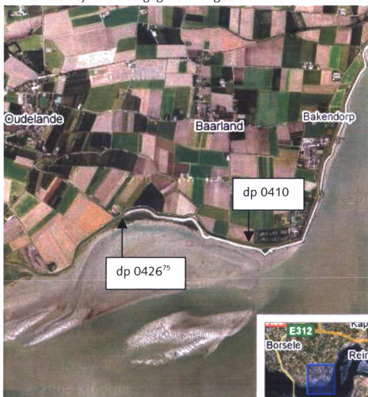
Figuur 1: Luchtfoto Zuid- en Baarlandpolder dp 0410 – dp 0426 75

Een luchtfoto van het traject is weergegeven in figuur 1.