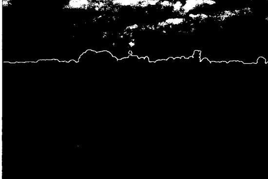
Grasland achter havenplateau