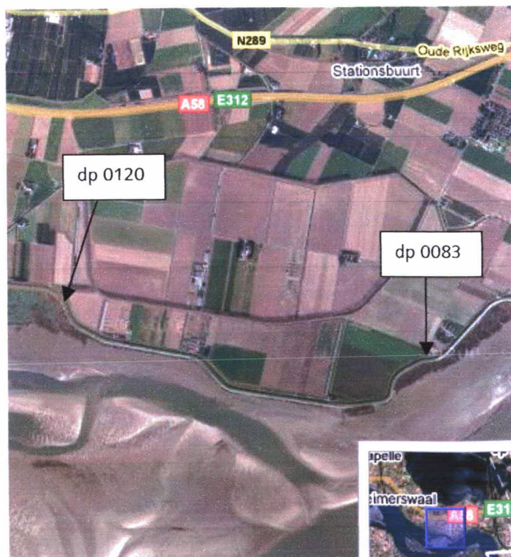
Figuur 1: Luchtfoto Zimmermanpolder dp 0083 – dp 0120

Een luchtfoto van het traject is weergegeven in figuur 1.