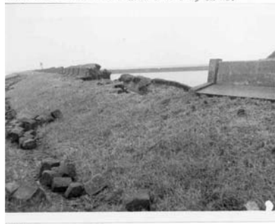
CC-5825 Foto R.W.S. No. 22 Zuid Beveland, Ellowoutsdijk. (Dijkvak 31, bij Dp. 48). Beschadiging van de betonnenmuur. Foto genomen vanaf de buitenberm. Zie foto R.W.S. No. 20.

De betonnen muur is over grote dijkgedeelten verdwenen.