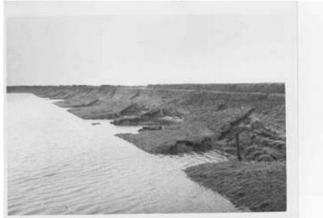
CC-5825 Foto R.W.S. No. 26 Zuid Beveland, Ellowoutsdijk. (Dijkvak 31, Dp. 50 - Dp. 49). Afschuiving van het binnentalud. Links: Ellowoutsdijkpolder. Zie foto P-1 en foto's R.W.S. No's 25 en 23.

Tijdens de storm is veel schade aan kruin en binnentalud opgetreden. Het gras op het binnentalud bleek niet voldoende sterkte te bieden.