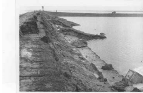
CC-5825 Foto R.W.S. No. 23 Zuid Beveland, Ellowoutsdijk. (Dijkvak 31, Dp. 49 - Dp. 50). Beschadiging van de kruin en het binnentalud. Rechts: Ellowoutsdijkpolder. Zie foto P-1 en foto's R.W.S. No's 25 en 26.