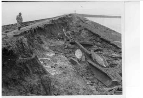
CC-5825 Foto R.W.S. No. 20 Zuid Beveland, Ellowoutsdijk. (Dijkvak 31, bij Dp. 48). Beschadiging van de betonnenmuur, de kruin en het binnentalud. Rechts: Westerschelde. Links: Ellowoutsdijkpolder. Foto R.W.S. No. 22.