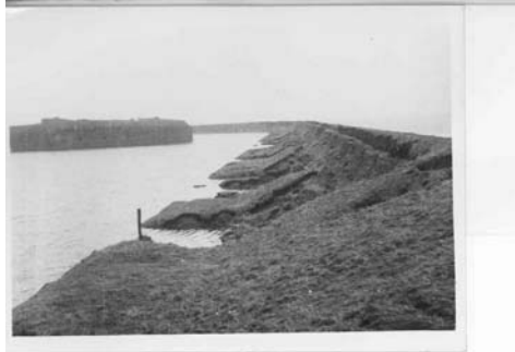
CC-5825 Foto R.W.S. No. 25 Zuid Beveland, Ellowoutsdijk. (Dijkvak 31, Dp. 50 - Dp. 49). Afschuiving en beschadiging van het binnentalud. Links: Ellowoutsdijkpolder, op de achtergrond het fort Ellowoutsdijk. Rechts: Westerschelde. Zie foto P-1 en foto's R.W.S. No's 26 en 23.

Tijdens de storm is veel schade aan kruin en binnentalud opgetreden. Het gras op het binnentalud bleek niet voldoende sterkte te bieden.