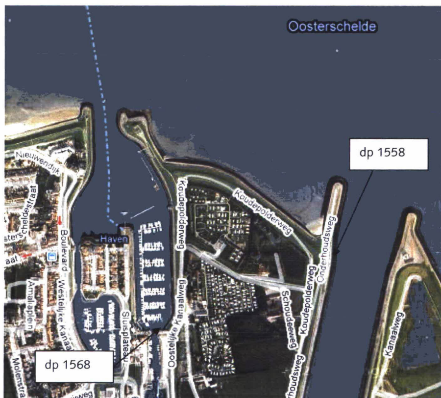
Figuur 1: Luchtfoto Snoodijkpolder

Een luchtfoto van het traject is weergegeven in figuur 1.