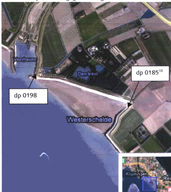
Figuur 1: Luchtfoto Oost-Inkelpolder dp 0185 10 – dp 0198

Een luchtfoto van het traject is weergegeven in figuur 1.