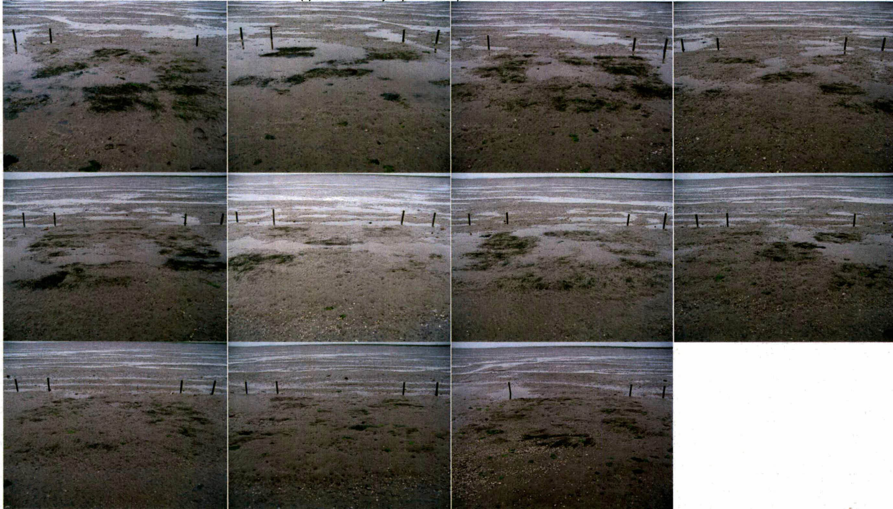
Rij 1: Van links naar rechts, van boven naar beneden: nr 17 t/m 27 (open hart – kansrijk- openhart enz.)

015941 2011 PZDB-V-11227 alen Verslag veldbezoek van zeegrasplots aangelegd 20