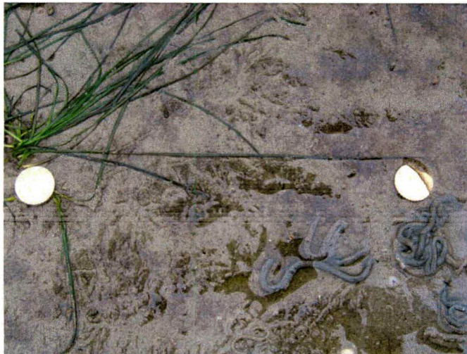
3) Lange zeegrasbladeren (25cm) in dichtbedekte plaggen (ter referentie 2 munten van 10 eurocent)