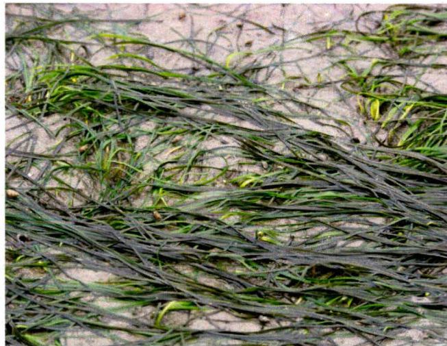
2) Detail van dichtbedekte plag in plot 17.